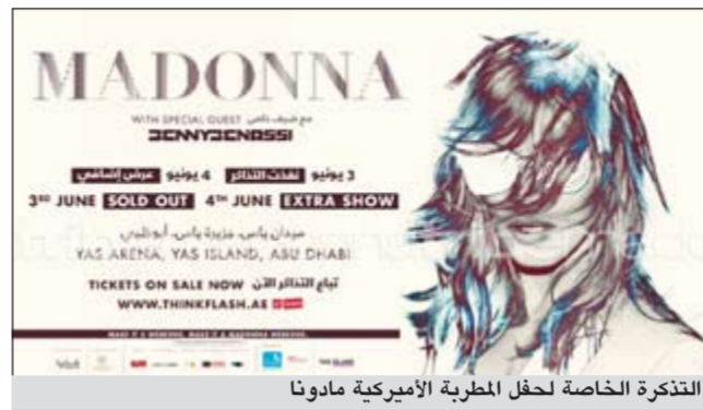
التذكرة الخاصة لحفل المطربة الأميركية مادونا

أن يدخل 26500 شخص في اليوم عن طريق 7 أبواب بما فيها أبواب كبار الشخصيات. وأكدت المصادر أن الجهة المنظمة تغلبت على درجات الحرارة