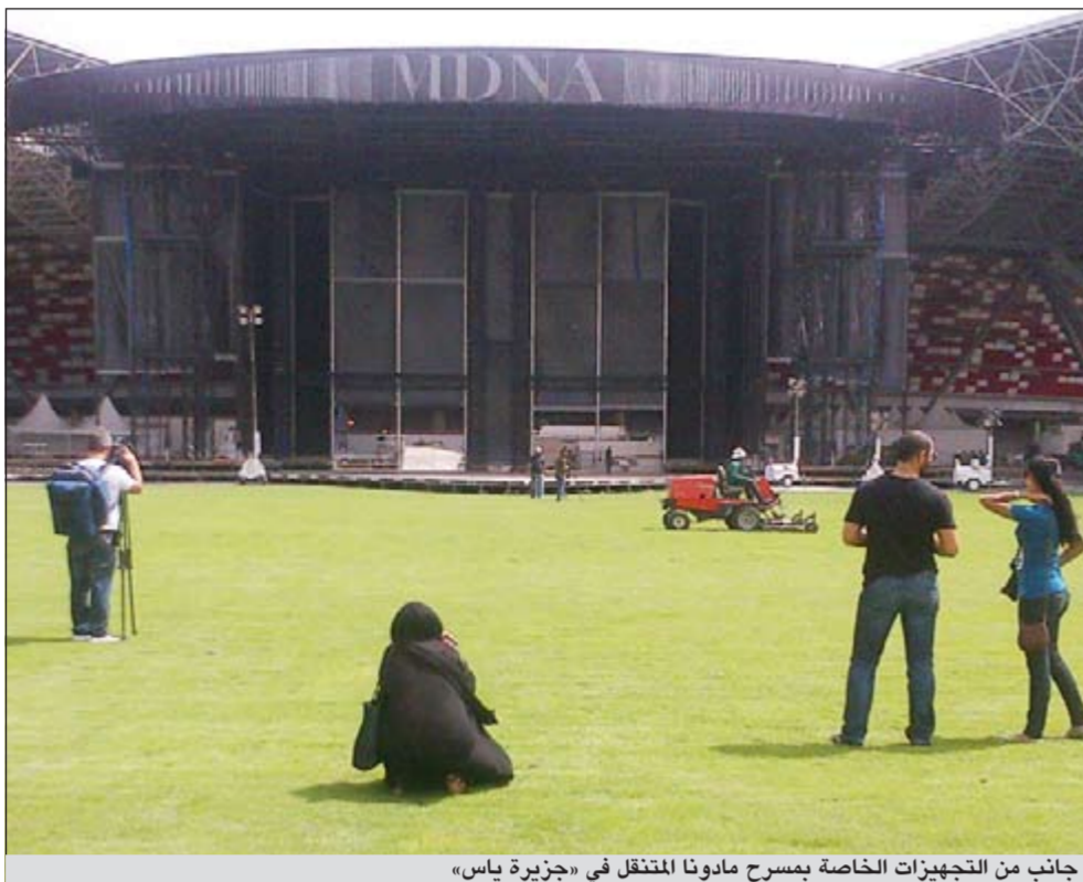
جانب من التجهيزات الخاصة بمسرح مادونا المنقلب في «جزيرة ياس»

ستصل الحرارة إلى 29 درجة وهو أشبه بجواء الشتاء في دول الخليج، خصوصاً أن هذه الأجواء تفضلها المطربة الأميركية مادونا للرقص والغناء، كما نكرت للجهة