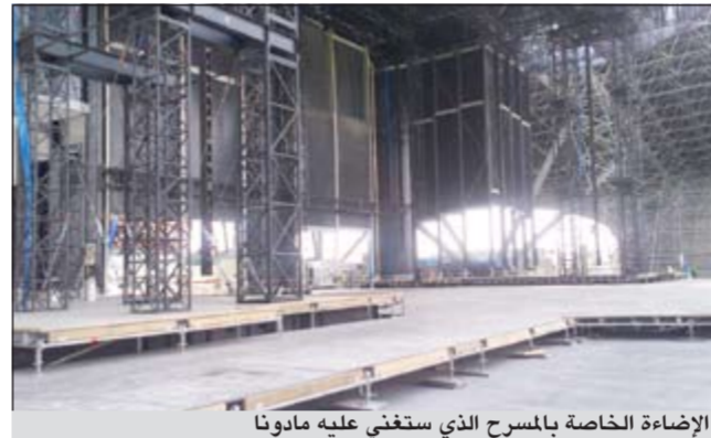
الإضاءة الخاصة بالمسرح الذي ستغني عليه مادونا

عن حفل مادونا من قبل 5 شهور، الأمر الذي اضطرها لتعديل عقدها ليوم آخر. وأكدت المصادر لـ «الأنباء» أنه رغم وجود معارضة من قبل