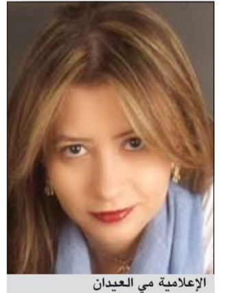
الإعلامية مي العيدان

أكدت الإعلامية مي العيدان أنها تقوم حالياً على تأسيس جريدة إلكترونية فنية هي الأولى من نوعها بالكويت تخصص فقط بأخبار وعالم الفن والإعلام والتي سوف تتراأس إدارة تحريرها بمشاركة نخبة من الكتاب مثل الإعلامية وداد المطوع وعبدالرحمن القطري وجاسم الشطي وعبدالعزيز الكندري ومجموعة من الشباب. وقد أوضحت أنها اتجهت إلى هذه الفكرة بعد أن تابعت حرص الجمهور على متابعة جميع الصحف والمطبوعات