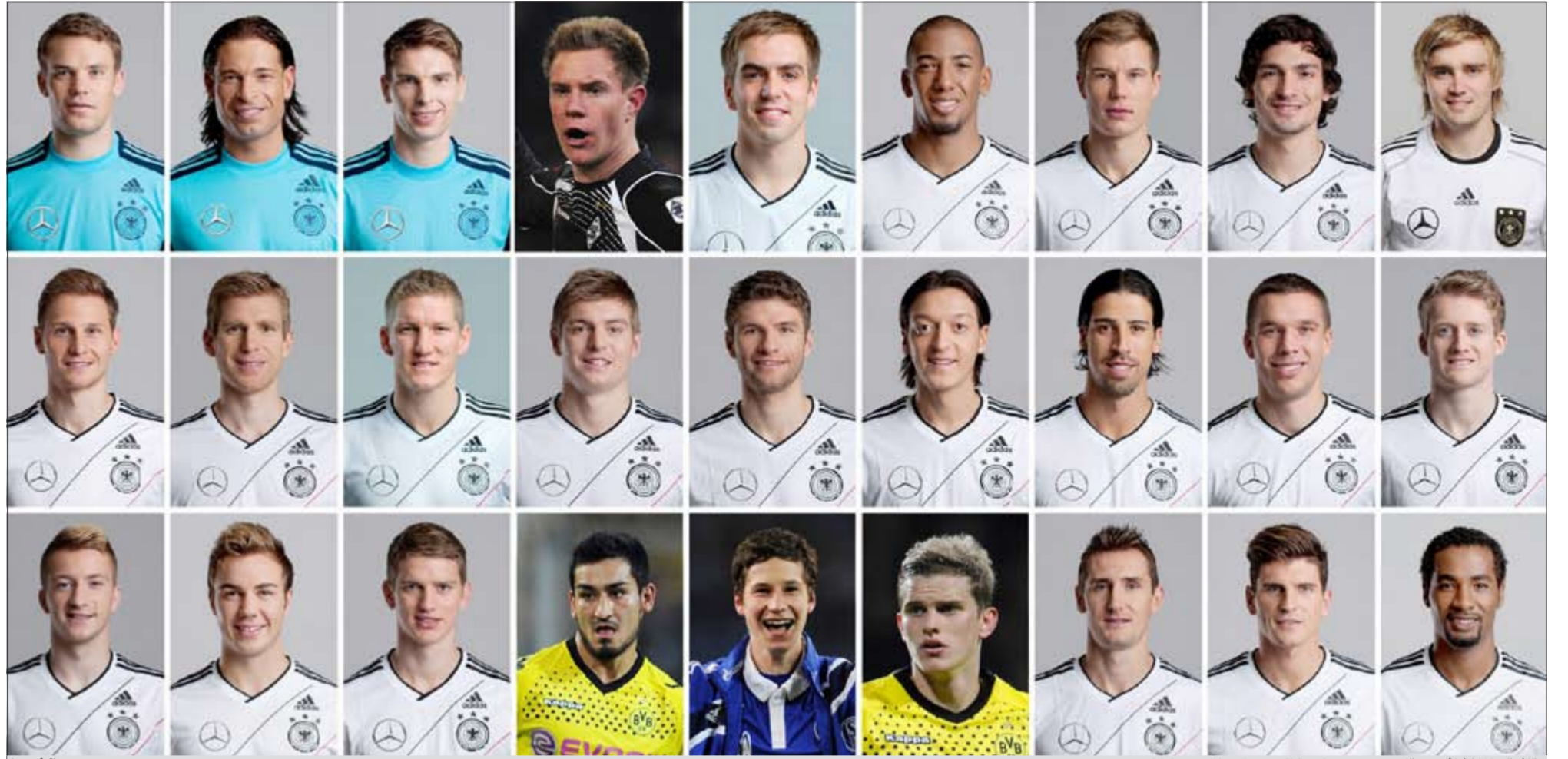
قائمة «المانشافت»، تقلصت من 27 لاعبا إلى 23 لاعبا استعدادا لـ «يورو 2012» (أ.ف.ب)