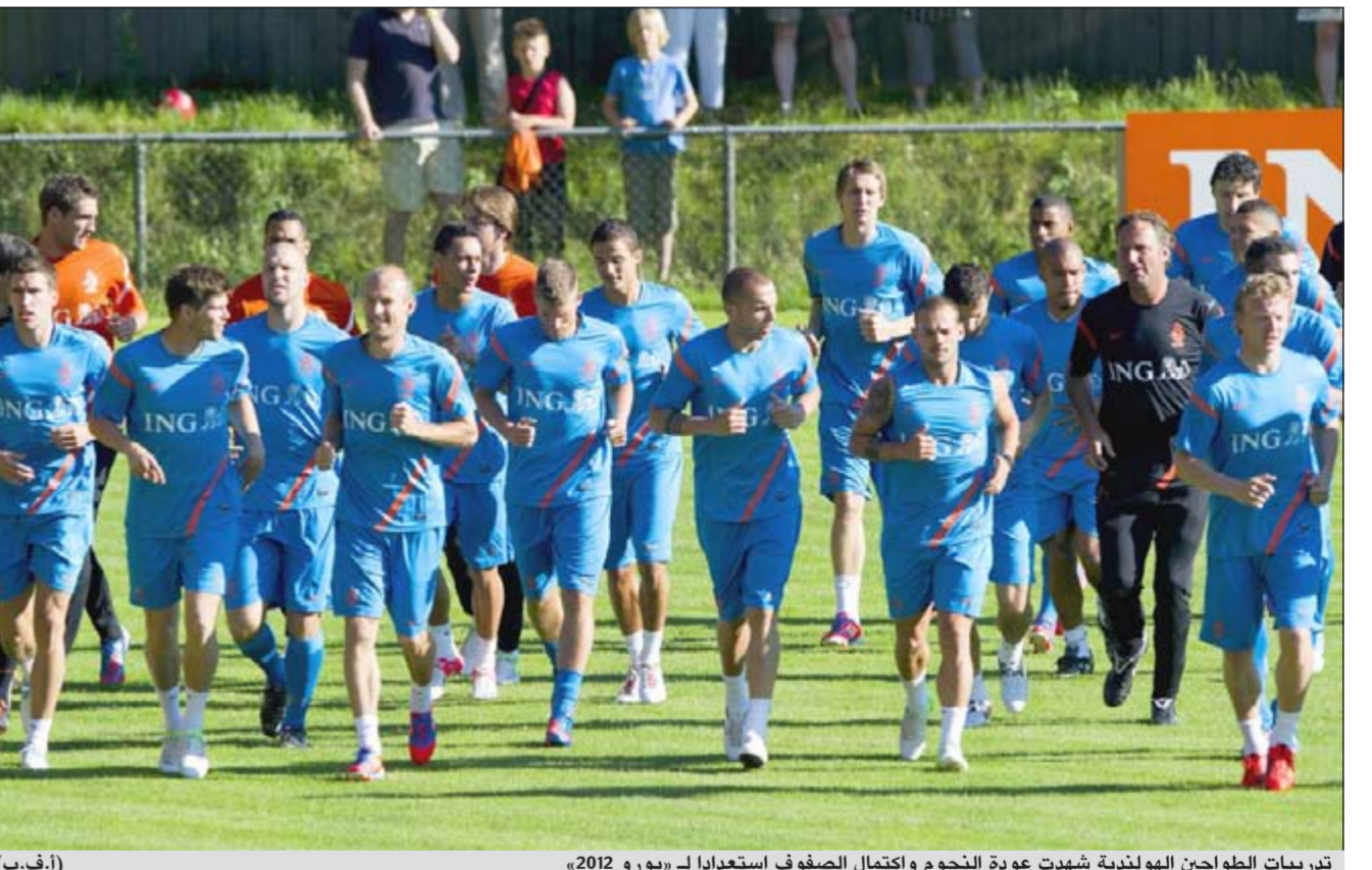
تدريبات الطواحين الهولندية شهدت عودة النجوم واكتمال الصفوف استعدادا لـ «يورو 2012» (أ.ف.ب)

المقدمة ما سيدخل نجم ارسنال في منافسة مع هدف الدوري الألماني يان كلاس هونتلار الذي تفوق عليه في التصفيات من خلال تسجيله 12 هدفا، مقابل 6 للالول. مما لا شك فيه ان فان بيرسي لاعب كبير جدا لكن التاريخ مليء بالنجوم الكبار الذين تالقوا على صعيد الاندية وفشلوا في الارتقاء الى نفس المستوى على صعيد المنتخب الوطني، وآخر الامثلة ليونيل ميسي بالذات، وبالتالي