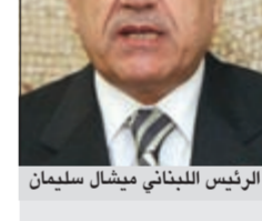
الرئيس اللبناني ميشال سليمان

علمت «الانباء» من مصادر مطلعة أن الرئيس اللبناني ميشال سليمان سيقوم الأحد المقبل بزيارة قصيرة إلى الكويت تستغرق يوماً واحداً يعود بعدها إلى بيروت. وقالت المصادر إن الزيارة ستبحث موضوع دعوة المواطنين الكويتيين إلى عدم زيارة لبنان، والمواطنين المقيمين فيه إلى مغادرتهم بسبب الظروف التي يعيشها لبنان حالياً.