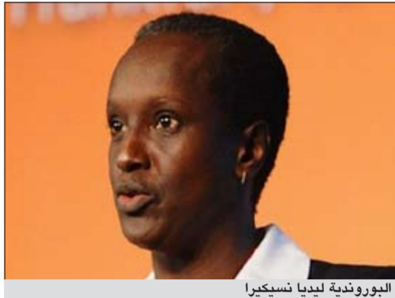
البيروندية ليديا نسيكيرا

دخلت البيروندية ليديا نسيكيرا كتب التاريخ بعد ان أصبحت اول سيدة انضم الى اللجنة التنفيذية في الاتحاد الدولي لكرة القدم الاسبوع الماضي. نسيكيرا (45 عاما) هي المرأة الوحيدة في العالم التي تترأس اتحاد بلادها، وكانت عضو لجنة السيدات في فيفا، لجنة كأس العالم للسيدات واللجنة التنظيمية في مسابقة كرة القدم لدورة الألعاب الاولمبية، وجاء التعيين الاخير بمنزلة خطوة جديدة في مسيرتها.