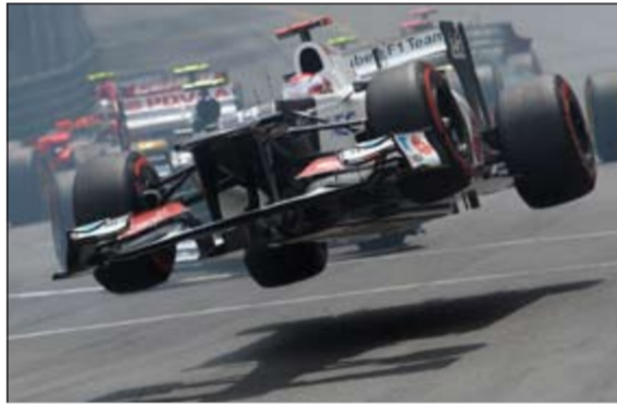
سيارة كوباياشي تطير قبل الارتطام

طار السائق الياباني كاموي كوباياشي في سيارته لفريق سببرز خلال إحدى الدورات في سباق الفورمولا 1 في موناكو.