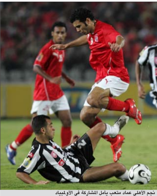
نجم الأهلي عماد متعب يامل المشاركة في الأولمبياد

اثبت جدارة كبيرة في مباريات الموسم الماضي قبل إلغاء الدوري المصري.