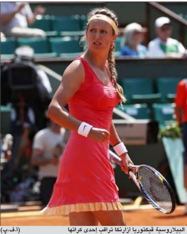
البيلاروسية فيكتوريا أزارنكا تراقب إحدى كراتها

ويبلغت الدور الثاني ايضا السلوفاكية دومينكا سيبولكوفا