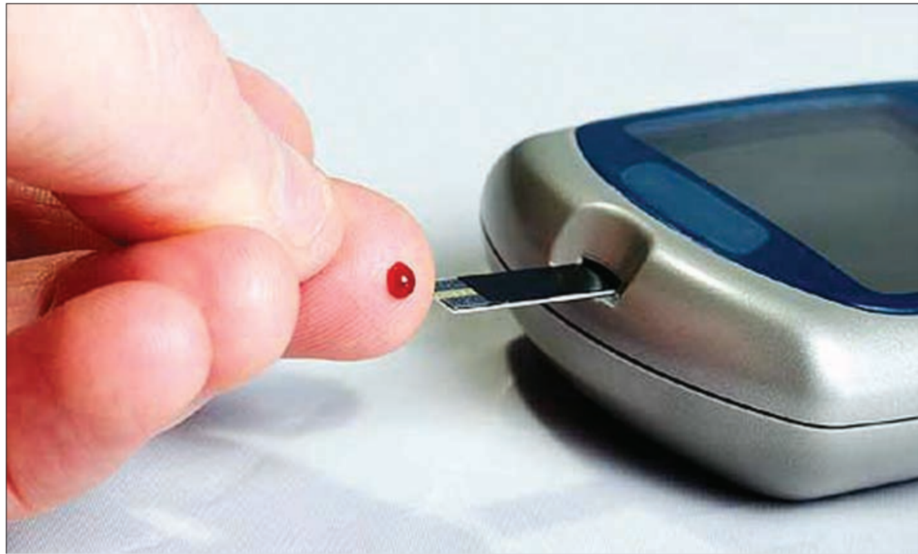
على مريض السكر إجراء فحوصات دورية تحسباً للمضاعفات