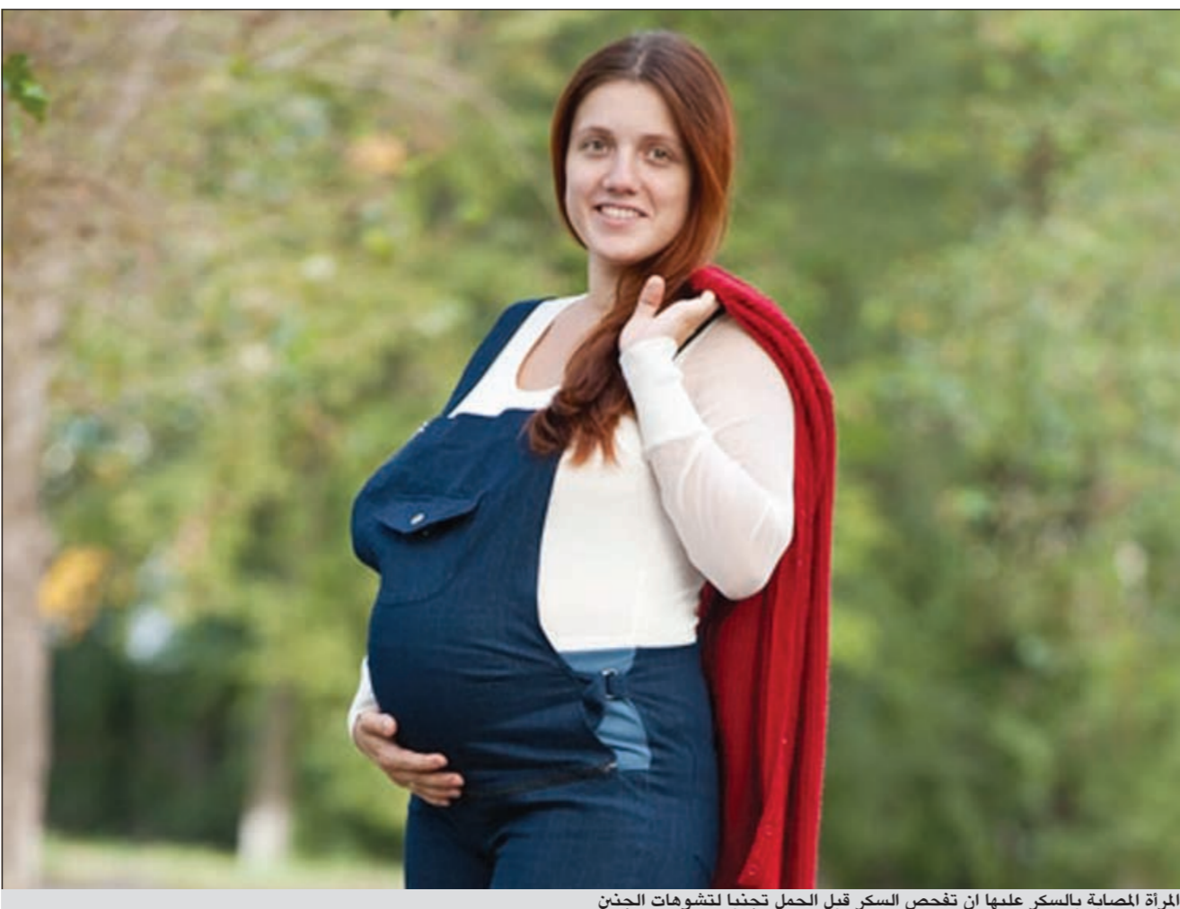
المراة المصابة بالسكر عليها ان تفحص السكر قبل الحمل تجنباً لتشوهات الجنين