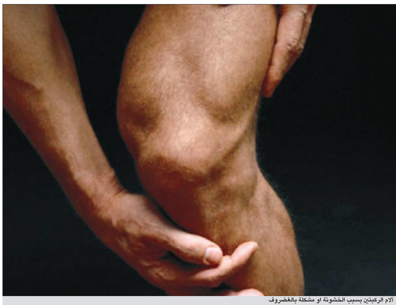
الأم الركبتيين بسبب خشونة او مشكلة بالغضروف

الغدة الدرقية؟ ● احببنا خمول الغدة الدرقية لا تكون له اعراض وتكتشف عن طريق الفحص واحتمال ان يصاب الشخص بتعب عام في الجسم او زيادة في النوم وقلة نشاط، وهناك من يشتكي من تساقط الشعر او جفاف في الجلد او اضطراب في الدورة الشهرية او الاصابة بالامساك ببعض المرضى يشعرون بالبرودة سريعاً ويتجهون الى الجو الحار، اما اعراض نشاط الغدة الدرقية فيكون على العكس من ذلك فالمرضى لا يستطيعون ان يجلسوا على الكراسي كثيراً من فرط نشاطه ويصيبه قلة نوم ويتحرك كثيراً وتصيبه رعشة باليد وتكون دقات قلبه سريعة او يعرق بشكل كبير ومنهم من يشعر بحرارة ويلجأ للجو البارد واحتمال ان يحدث معه جحوظ بالعين، او اسهال او اضطراب في الدورة الشهرية وتكون كمية الدم قليلة جدا مع نشاط الغدة الدرقية. كيف يكون علاج خمول ونشاط الغدة؟ ● علاج خمول الغدة هو اعطاء حبة الغدة، اما علاج نشاطها