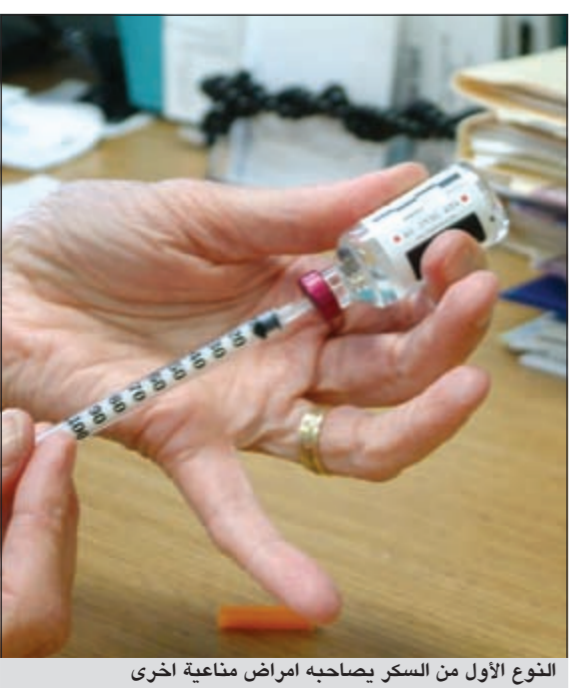
النوع الأول من السكر يصاحبه امراض مناعية اخرى

لتلافي آلام الرقبة.. يجب الجلوس والظهر مستقيماً مع إجراء تمارين بسيطة لها