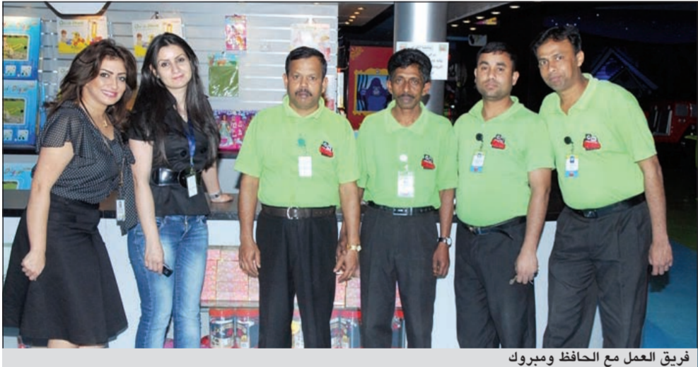
فريق العمل مع الحافظ ومبروك