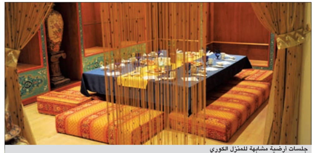
جلسات أرضية مشابهة للمنزل الكوري