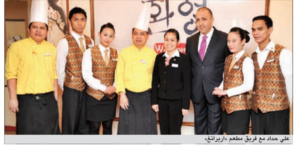
على حداد مع فريق مطعم «أيرانغ»

«أيرانغ» هو المطعم الكوري الوحيد في الكويت الذي يقدم الأطباق الكورية التقليدية. وأضاف ان المطعم يقدم قائمة طعام متنوعة بالأطباق الكورية ويشعر بدفء المكان مع اضاءة المصابيح المصنوعة يدوياً بالإضافة الى الموسيقى الكورية الهادئة بحيث يعكس الجو بنكهة الطعام اللذيذ الغني بالتوابل الذي يرضي جميع الأذواق.