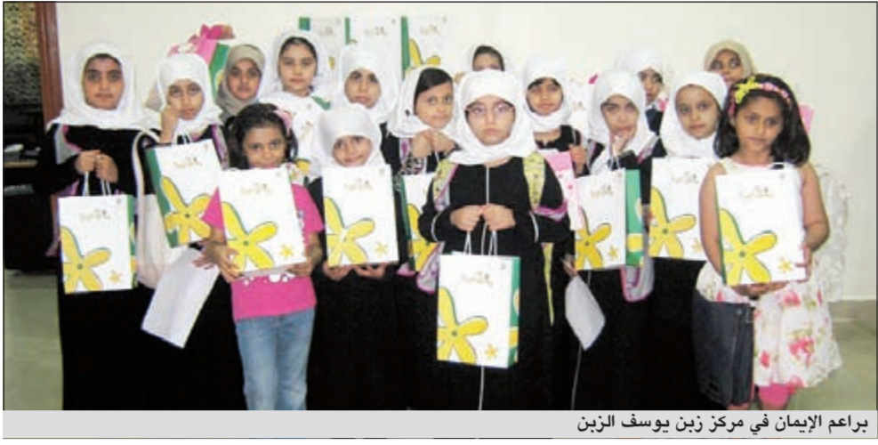
براعم الإيمان في مركز زين يوسف الزين