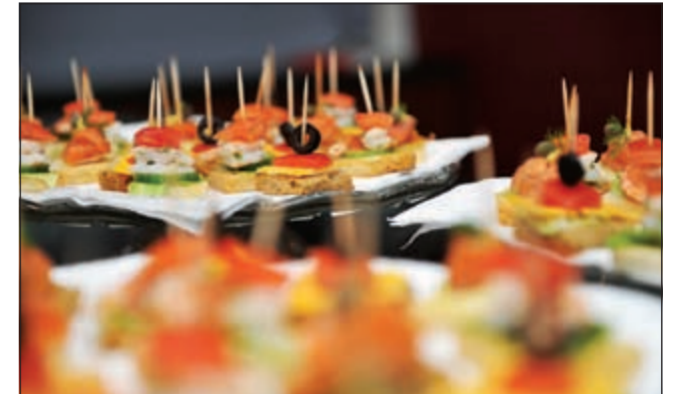
أشهى الأطباق الكورية