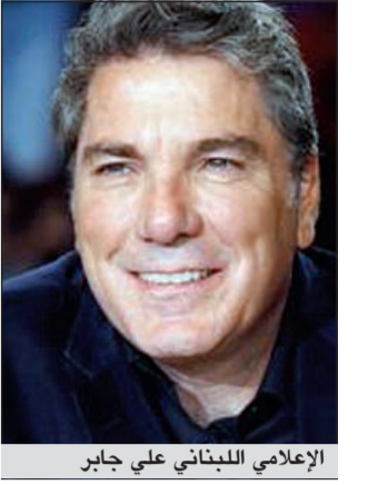
الإعلامي اللبناني علي جابر

رفض الإعلامي اللبناني علي جابر اتهامه بأنه ظالم في أحكامه على مواهب «غوت تالنت». وقال جابر تعليقا على هذا الأمر: لست ظالما بل جديا وصارما، لا أوزع شهاداتي على من لا يستحق، أظلم الشخص عندما أقول عنه جيد وهو ليس كذلك، لأنني أعتقد أن كلمة «فشل» التي اعتبرها قاسية بعض الشيء، مهمة جدا في الحياة وهي الطريقة الوحيدة للتعلم، بشرط ألا تخبط عزيمة الإنسان، فالفشل من أهم أدوات النجاح.