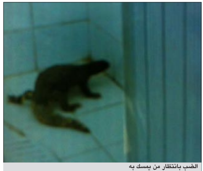
الضرب بانتظار من يمسك به

دبت حالة من الرعب والفرع بين معلمات مدرسة ابتدائية في منطقة الصباحية اثر مشاهدة احدي المدرسات ضبا يسرح ويمرح داخل حمامات الهيئة التدريسية، الطريف في هذه القصة ان المدرسات استنجدن بحارس مصري الجنسية ليتعامل مع الضب فما كان من الحارس إلا ان