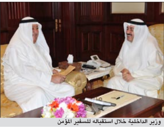
وزير الداخلية خلال استقباله للسفير المؤمن