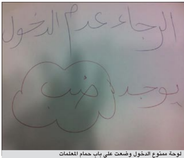
لوحة ممنوع الدخول وضعت على باب حمام المعلمات

رجال الأمن انتقلوا للتعامل مع البلاغ. وأضاف المصدر: لدى انتقالنا الى البلاغ وجدنا المعلمات قد أغلقن الباب الخارجي للحمام ولزيادة الحذر وضعن ورقة سدون عليهما: «الرجاء عدم الدخول يوجد ضب».