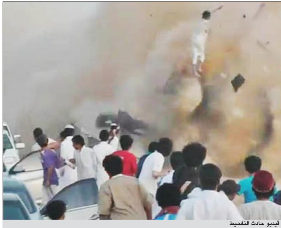
فيديو حادث التفحيط

الرياض: تناقل عدد من مستخدمي الشبكات الاجتماعية خلال الساعات الماضية مقطع فيديو «بشع» لا تتجاوز مدته 1,5 دقيقة، صور حادثة تفحيط راح ضحيتها شابان في مدينة الرياض، فجر الجمعة الماضي، وأُعلنت رعب المتجمهرين في الموقع. وبحسب موقع «سبق»، أظهر المقطع انقلاب السيارة أكثر من 5 مرات، وطيران السائق ومرافقه من داخلها، في مشهد مروع أظهر بتر يد أحدهما وتراجع الآخر في الهواء قبل أن يسقط كلاهما على الأرض. مصادر «سبق» كشفت أن الحادث وقع فجر الجمعة الماضي في الدائري الغربي الجديد بمدينة الرياض، بالقرب من جامع العسيري المعروف، مبيته أنه سجل كحادث تفحيط، من واقع شهادة شهود عيان إضافة إلى مقاطع الفيديو. وأشارت المصادر إلى أن قائد السيارة الكاميري 2012 رصاصية اللون كان يمارس التفحيط، ويرافقه شخص آخر حتى انحرفت السيارة وتعرضت للانقلاب، ما أسفر عن وفاتهما.