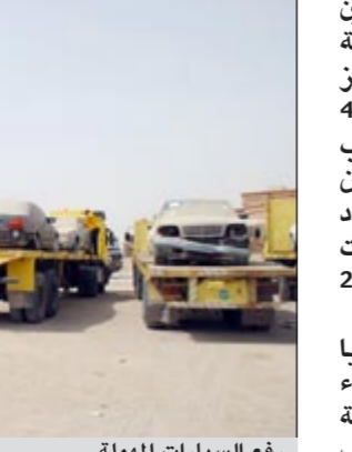
رفع السيارات المهملة

تقوم بفرض رقابة مشددة على سيارات نقل المواد الغذائية باعتبارها إحدى أهم مراحل السلسلة الغذائية قبل وصول المنتج للمستهلكين، مشيراً إلى أن فرق التفتيش تتابع مدى التزام هذه السيارات بالضوابط التي وضعتها الجهات فيما يتعلق بعملية تبريد الأغذية والنظافة وجميع الضوابط الأخرى التي حددها الجهاز كشرط أساسي للحصول على تصريح ممارسة عملها. وأوضح أن الأجهزة الرقابية عليها جميع الترتيبات اللازمة لتكثيف الحملات الخاصة