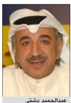
عبد الحميد دشتي

أعلن النائب عبد الحميد دشتي انه انتهى من التحقيق في النيابة العامة بعد ان تم قبول الشكوى المقدمة ضد النائب مبارك الوعلان، مشيراً الى ان الدعوى أخذت رقم 2012/413 وكما وعدتكم بأن أكون شفافاً في موضوع ما نسب لي الاثر الزميل النائب مبارك الوعلان. وذكر دشتي: ان ما نسب لي الوعلان زورا وبهتانا وجهت العديد من الاسئلة والزميل ملزم بان يقدم كل ما لديه من مستندات والتي أفصح انه يمتلكها. وقال دشتي: يستوجب طلب وزارة الداخلية لتوافي النيابة بالمستندات اضافة الى نسخة من المستندات التي قدمها على المنصة، وطلب من وزارة الخارجية متابعة الموضوع للتأكد من صحة هذه المستندات، ولفت دشتي الى ان الموضوع في عهدة القضاء ولا بد من الرأي العام ان يطالع على هذه الخطوات.