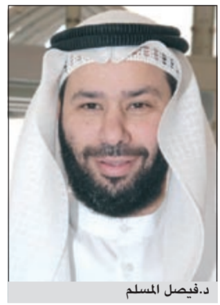
د. فيصل المسلم

عقدت لجنة المرافق العامة اجتماعاً أمس بصفتها لجنة تحقيق وفق تكليف المجلس حول أسباب إغلاق المسجد الكبير، وأبلغت وزارة الأشغال اللجنة بأن مشكلة المسجد الكبير معمارية (في الديكورات) وليست إنشائية، وطلبت للجنة من إدارة المسجد فتح المسجد في رمضان أمام المصلين، خاصة الصلوات الأخرى من غير الصلاة الرئيسية. وقال رئيس لجنة المرافق النائب د. فيصل المسلم في تصريح للصحافيين أمس «اجتمعت لجنة المرافق العامة، بصفتها لجنة