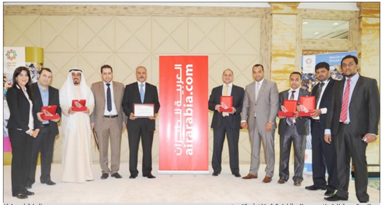
ممثلو «العربية للطيران» مع ممثلي أفضل 5 شركات في الكويت