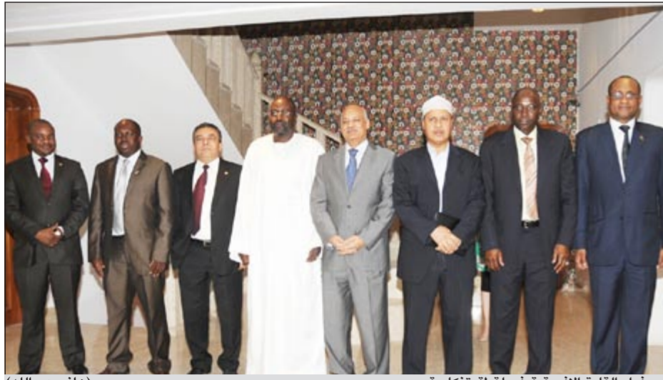
سفراء القارة الإفريقية في لحظة تذكارية (هاني عبدالله)

أفريقيا للاستثمار فيها. من جانبه، أكد السفير المصري لدى البلاد عبد الكريم سليمان على الدور المصري في القارة الإفريقية والعمل على حل مشاكلها متحدًا عن نيته في عقد ندوة عن تلك القارة بعد الانتهاء من الجولة الثانية من الانتخابات الرئاسية التي ستجري الشهر المقبل. وتطرق في كلمته إلى النشاطات التي قامت بها السفارة خلال فترة وجوده في الكويت، مبينًا أن السفارة أقامت 8 معارض متنوعة في المجالات الثقافية والسياحية والعمارة إلى جانب تبادل الزيارات بين كبار مسؤولي البلدين حيث زار الكويت وفد برلماني برئاسة رئيس مجلس الشعب المصري وضم 13 نائبًا في أول زيارة إلى خارج مصر بعد الانتخابات، فضلًا عن زيارات وزير الخارجية ووزير التربية ومحافظ القاهرة، إضافة إلى التوقيع على مذكرة تفاهم مع الصندوق الكويتي لقروض تتعلق بإقامة مشاريع في بلاده.