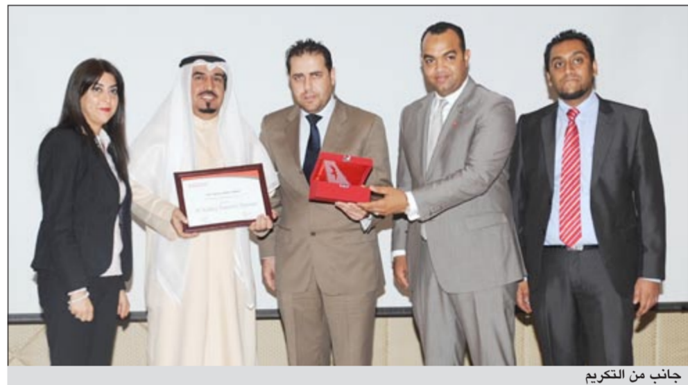
جانب من الترويج