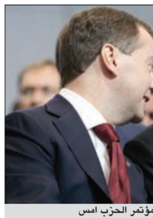
قلايديير بوتين وديمترى مدقيدف في مؤتمر الحزب امس

الشباب «الأولوية المطلقة». إلا أن مدقيدف أقر مع ذلك بان «عامل الوهن بدأ يؤثر على الحزب، الذي يهيمن على مجلس النواب الروسي منذ انشائه في 2003. من جهة أخرى، تكثرت صحيفة «يديعوت أحرروت»، الإسرائيلية الليبرالية اسم ان الرئيس الروسي بوتين سيوزر إسرائيل أواخر شهر يونيو المقبل على رأس وفد رفيع المستوى لإجراء محادثات مع المسؤولين الإسرائيليين حول أحدث المستجدات على الساحتين الدولية والإقليمية. وأفادت الصحيفة - في نيا أوردهت على موقعها الإلكتروني - بأن بوتين سيلقي خلال زيارته، في أيلول، في موسكو، في 15 مليون دولار لحملته أثناء مأدبة عشاء في هوليوود في العاشر من مايو. وقد دفع المدعون حتى 40 ألف دولار مقابل شرف تناول العشاء مع الرئيس الأميركي.