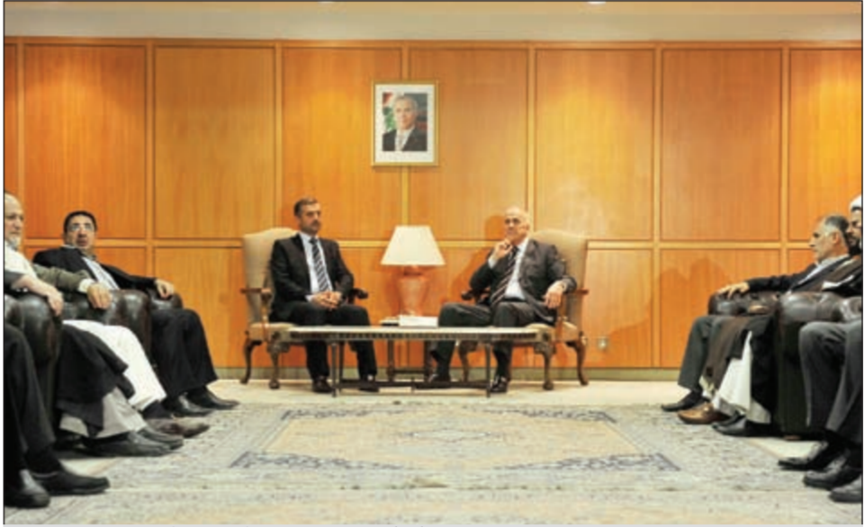
وزير الداخلية وعدد من المسؤولين خلال انتظارهم وصول المخطوفين في المطار حتى وقت متأخر امس الأول (محمود الطويل)

مكتفة مع القادة الاثراك كان من المقرر ان اقوم اليوم بزيارة شكر الى تركيا نتجحة افتراض الافراج عن المواطنين اللبنانيين.