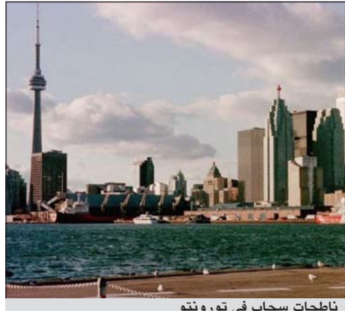
ناطحات سحاب في تورونتو

مونتريال - أ.ف.ب: أعلن مصرف «سكوتيا» وهو الثالث في كندا وله انتشار في الخارج أيضاً، بيع ناظحة السحاب التي يملكها في تورونتو بسعر 1,27 مليار دولار كندي، وهو سعر قياسي لمبنى مكاتب في كندا. واشترى المبنى المصنوع من الفولاذ الأحمر والمؤلف من 68 طابقاً، صندوقاً للاستثمارات العقارية «داندي» و«اتش آند آر». ناظحة السحاب الواقعة في وسط حي الأعمال يضم مساحة 185 ألف متر مربع، 99,5٪ منها مشغولة، وسيتملك صندوق «داندي» ثلثي المبنى و«اتش آند آر» الحصة المتبقية. وعرض مصرف سكوتيا المبنى للبيع في يناير بسبب قانون مصرفي جديد يفرض زيادة الاحتياطي، على ما يبدو. ويفترض أن تصحح الصفقة نهائية في 20 يونيو المقبل. وهي أتت في إطار مزادات شرسة على عدة أبراج تضم مكاتب في كبرى المدن الكندية إذ أن نسب الفائدة البنديّة والطلب الشديد على المكاتب يحفزان هذه السوق.