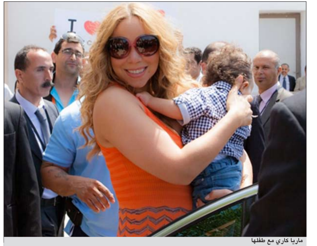
ماريا كاري مع طفلها

الرباط - العربية: اختتمت الفنانة العالمية ماريا كاري آخر أنشطتها مهرجان موازين في العاصمة المغربية، في الوقت الذي سيجي فيه الفنان اللبناني وأثل كفوري حفلته الختامي على منصة النهضة، خلافاً لكاري التي ستحفي حفلها بمنصة السويسي المخصصة للفريق العالمية. وكانت ماريا استقبلت في مطار محمد الخامس في الدار البيضاء وسط حشد من الإعلاميين والعجبين حاملة طفلها موروكو، الذي أطلقت عليه اسم المغرب باللغة الإنجليزية، تيمناً بهذا البلد وحجتها لثقافته، بحسب قولها، وجاء تصريحها في مؤتمر صحافي، حيث أكدت أنها أتت به إلى المغرب ليتعرف على