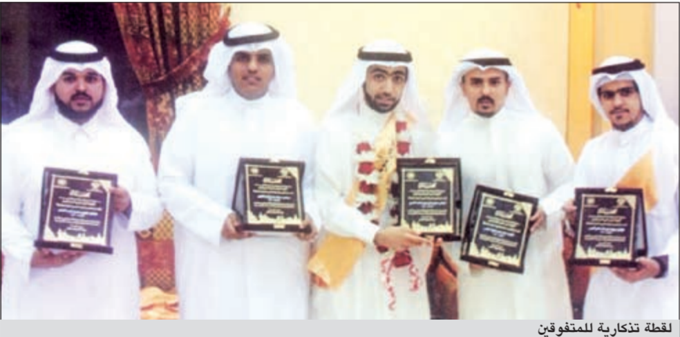
لقطة تذكارية للمتفوقين

المباركة من الأهل والأصدقاء الذين تمنوا لهم حياة حافلة بالنجاح والتفوق، ألف مبروك وعقبال الجامعة.