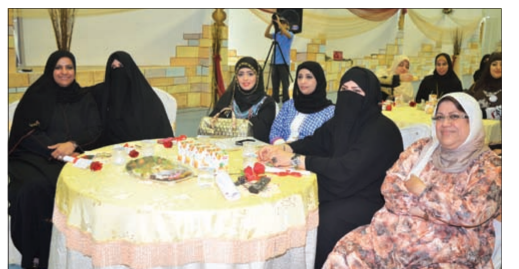
مديرات المدارس يتابعن فقرات الحفل