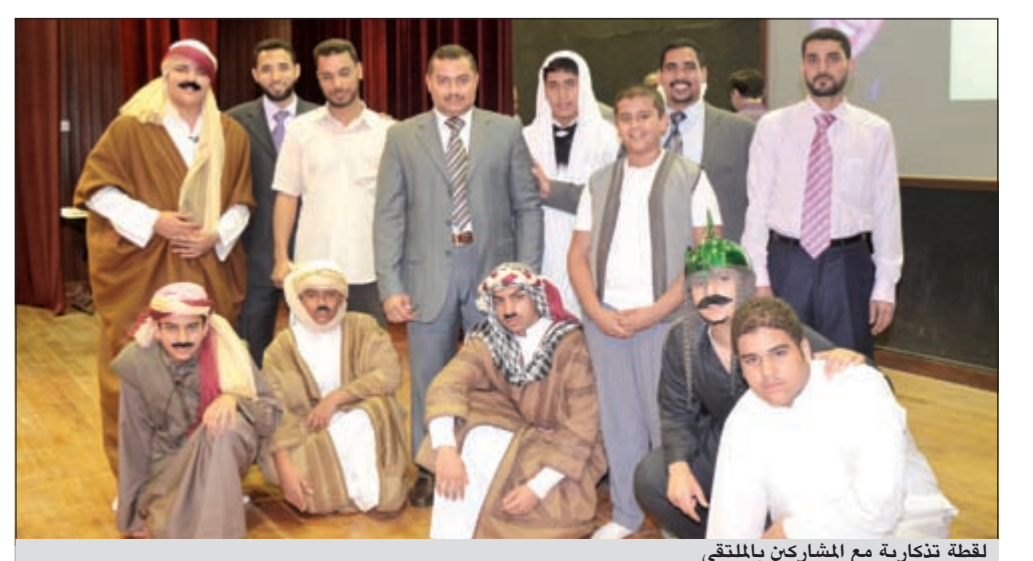
لقطة تذكارية مع المشاركين بالملتقى