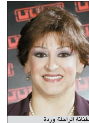
الفنانة الراحلة وردة