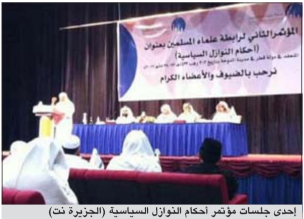
إحدى جلسات مؤتمر أحكام النوازل السياسية

إلى ذلك، أعلنت كاترين آشتون مفوضة الشؤون الخارجية والأمن بالاتحاد الأوروبي أن المشاركين في الجولة الأخيرة من المفاوضات بشأن برنامج إيران النووي المعروفة باسم (خمسة + واحد) اتفقوا على عقد الجولة القادمة من المفاوضات بموسكو يوم 18 و19 يونيو المقبل.