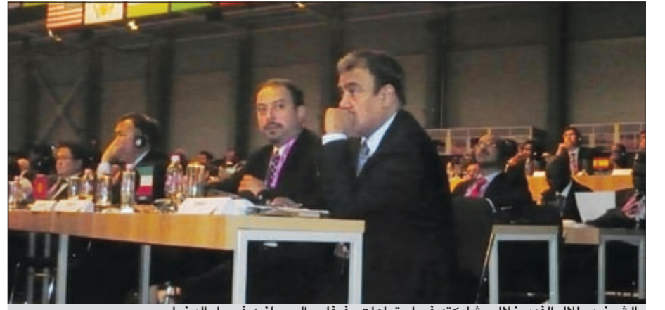
الشيخ د. طلال الفهد خلال مشاركته في اجتماعات «فيفا»، وإلى جانبه فيصل الدخيل

السدول الأعضاء داخل الكتلة الآسيوية أكد الفهد ان قرارات الاتحاد الآسيوي موحدة وان الدول الأعضاء لا تشارك في اجتماعات الاتحاد الدولي الا بعد التحضير والتنسيق الجيدين ككتلة واحدة.