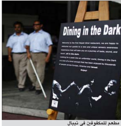
مطعم للمكفوفين في نيبال

كاتمندو - د.ب.أ: افتتح مؤخرا أول مطعم للمكفوفين في نيبال. ويوجد المطعم في كاتمندو وهو جزء من مشروع تموله السفارة الإسرائيلية لدعم الناس ذوي الإحتياجات الخاصة ويسمح للمبصرين أيضا بتجربة ما يشعر به المكفوفون في المطاعم. والمطعم الذي يحمل اسم «الأكلة في الظلام»، عبارة عن صالة ممتعة ومغطاة بطبقات من الستائر السوداء، ويستعين المطعم بخمسة جرسونات ذكور يعانون من عيوب وضعف في الإبصار تم تدريبهم حيث لا يوجد سوى أربع طاولات فقط في المطعم.