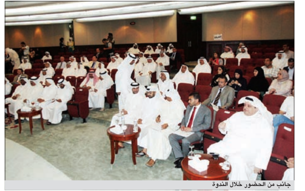
جانب من الحضور خلال الندوة

وأشار إلى ان الصناعيين يجتمعون اليوم (امس) مع نخبة من اصحاب الشأن والاختصاص لنلقي الضوء على أحد أهم العلاجات لهذه الظاهرة التي ألحقت أضرارا كبيرة باقتصادات دول العالم ونالت حيزا كبيرا من اهتمام المستثمرين الصناعيين، وأقرت التجمعات الاقتصادية بتأثيرها السلبية على البنى الصناعية واقتصادية ولما تسببه من