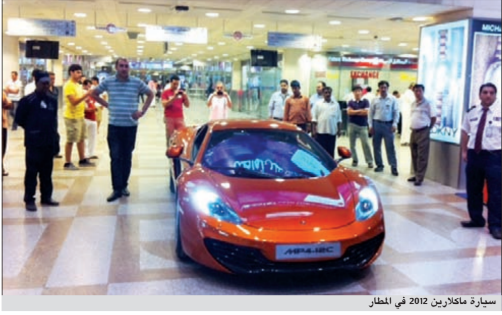
سيارة مكلارين 2012 في المطار

لعملاء البنك الوطني الفوز بهذه السيارة الفاخرة او بالجوائز النقدية عن طريق السحوبات التي يدخلون فيها تلقائياً مقابل كل 20 دينارا يتم انفاقها باستخدام بطاقات الدفع المسبق وبطاقات الوطني الائتمانية داخل الكويت، فيما ستتضاعف فرصهم للفوز ثلاث مرات باستخدامهم بطاقات الدفع المسبق وبطاقات الوطني الائتمانية الى جانب بطاقة السحب الآلي خارج الكويت او من خلال الانترنت.