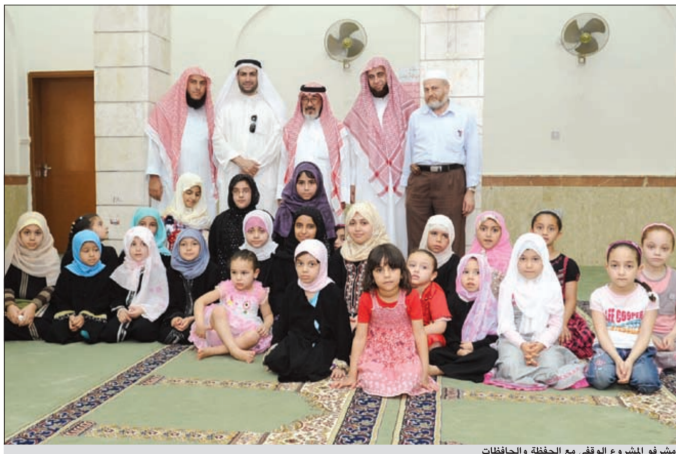
مشرفو المشروع الوقفي مع الحفظة والحافظات