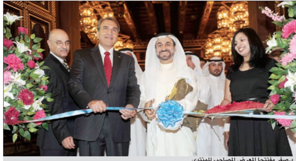
د.صفر مفتتحا المعرض المصاحب للمنتدى

أكد وزير الأشغال العامة والتخطيط د.فاضل صفر أن هناك اهتماما كبيرا بنشر ثقافة المباني الخضراء في الكويت من قبل كافة الجهات المعنية لما لهذا النظام من فوائد بيئية متعددة لافتا إلى أن أول تجربة في الكويت ستتم فوق مبني نزع الملكية الجديد في جنوب السرة كما سيتم تطبيقه في مبني الركاب رقم 2 في مطار الكويت الدولي، حيث سيكون هناك خلايا ضوئية تستقبل الطاقة البيئية وذلك بهدف الحصول على المركز الذهبي عالميا في تطبيق نظام المباني الخضراء من خلال تجربة المطار، جاء ذلك خلال المنتدى الكويتي للمباني الخضراء الذي عقد صباح امس تحت رعاية وبحضور نخبة من خبراء البيئة والتخطيط على المستوى المحلي والخليجي والعالمي.