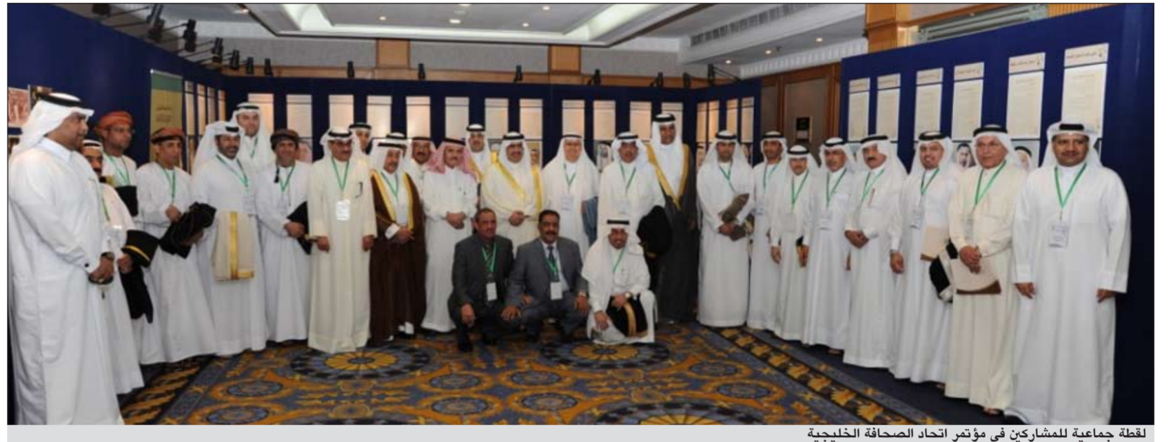
لقطة جماعية للمشاركين في مؤتمر اتحاد الصحافة الخليجية

كل دولة من دول مجلس التعاون في المجلس المقبل. وأضاف ان المؤتمر وافق على استضافة الكويت (ملتقى الصحافيات الخليجيات) وذلك من منطلق الاهتمام ودعم الصحافيات الخليجيات ورعايتهن سواء من العاملين في القطاع الحكومي او الخاص، موجها في الوقت نفسه شكره لاستضافة مملكة البحرين ورعايتها للمؤتمر.