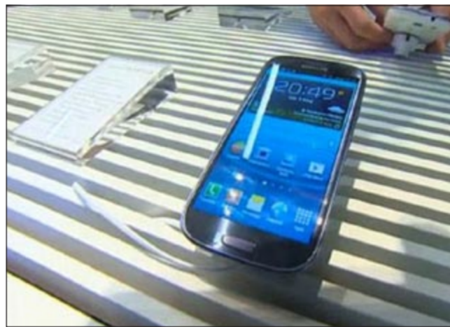
المشاحنات القانونية يبدو جليا ارتباطها الوثيق. محللون يؤكدون أن 15٪

من أرباح سامسونغ تأتي من مبيعاتها لأبل. ويمكن للشركة الأميركية أن تهدد بالاعتماد على شركات أخرى في أجهزتها والابتعاد عن سامسونغ، ولكن هذه الخطوة ستكون مكلفة. ورغم خشية خسارة آبل كعميل رئيسي جراء تزايد القضايا القانونية، إلا أن سامسونغ قد تعتقد أنه ليس هناك أسوأ من الدعاية السيئة. يجمع معظم المحللين على أن الوقت حان للخصمين لإنهاء الخلافات بينهما والعمل من أجل التوصل لتسوية خارج المحكمة.. لكن يبدو حتى الآن أن الجهة الوحيدة المستفيدة من الوضع الراهن هم رجال الحمامة.