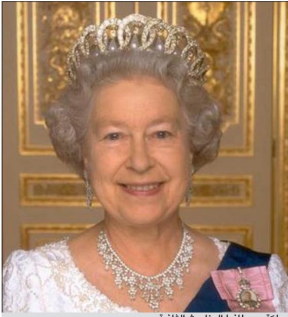
ملكة بريطانيا اليزابيث الثانية

لندن - كونا: نالت ملكة بريطانيا اليزابيث الثانية لقب أكثر الشخصيات العامة فوق الستين احتراماً حيث تحتفل هذا العام بالذكرى الستين لتربعها على العرش. وتصدرت الملكة اليزابيث (86 عاماً) الاستطلاع الذي أجرته مؤسسة «أصدقاء المسنين» الخيرية متقدمة على زعيم جنوب أفريقيا الأسطوري نيلسون مانديلا.