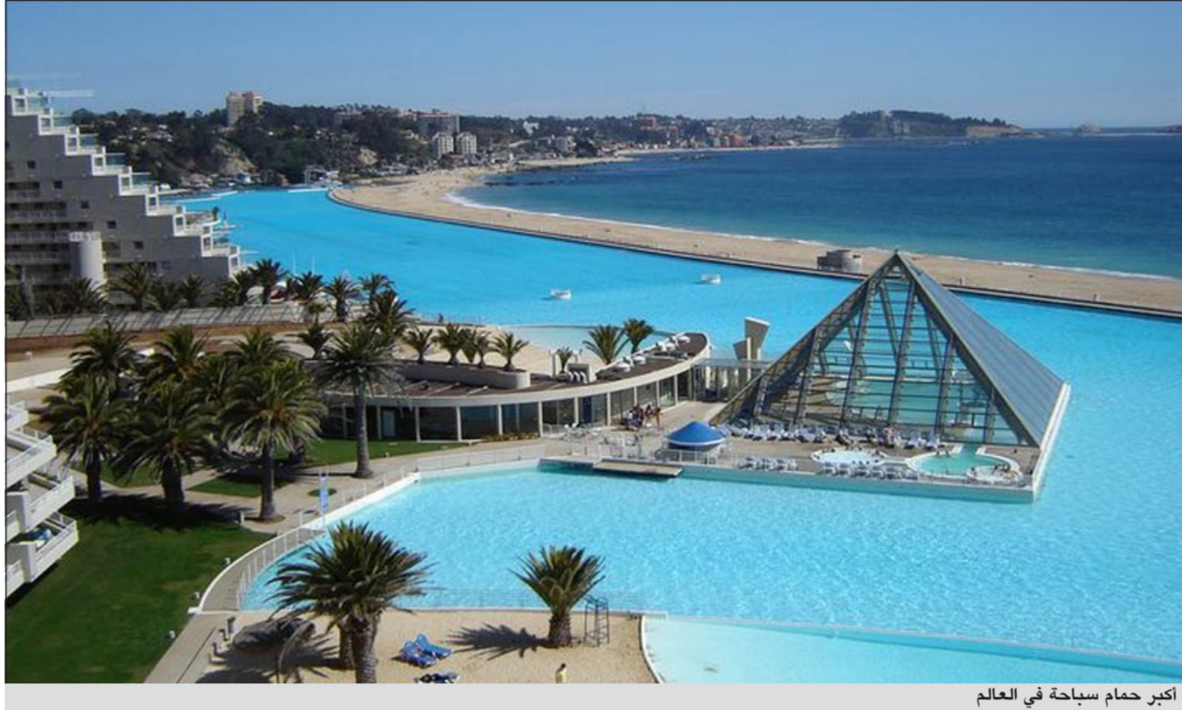
أكبر حمام سباحة في العالم

ودخل المسبح موسوعة غينيس باعتباره أعرق حمام سباحة في العالم، إذ يبلغ عمقه 115 قدماً، ما يعطي فرصة الغوص للراغبين في الاستمتاع بهذه الرياضة. ويعبأ ويفرغ المسبح - الذي شيدته شركة كريستال لاجون التشيلية بمحاذاة ساحل