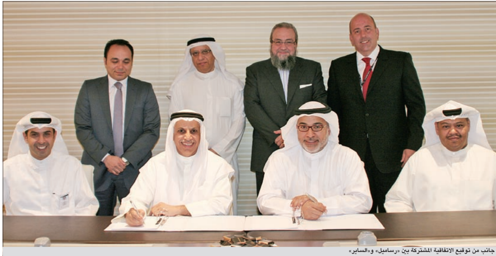
جانب من توقيع الاتفاقية المشتركة بين «رساميل» و«الساير»