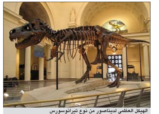
الهيكل العظمي لديناصور من نوع تيرانوسورس

العربية: بيع هيكل عظمي كامل تقريبا لديناصور من نوع تيرانوسورس بمبلغ 1,05 مليون دولار، في مزاد بنيويورك أمس الأول الأحد، على الرغم من أن المزاد شهد اعتراضا من حكومة منغوليا التي سألت عما إذا ما كان تم الحصول على الهيكل بصورة قانونية. وذكر بيان لدار مزادات هيرتاج التي أجرت المزاد في نيويورك أن الهيكل العظمي لتيرانوسورس باتار قريب على الديناصور تيرانوسورس ريكس الذي كان يجوب أمريكا الشمالية خلال العصر الطباشيري منذ حوالي 80 مليون سنة، ويبلغ ارتفاعه 4,2 امتار وطوله 3,7 امتار. ويحسب وكالة «رويترز» اكتشاف الهيكل في صحراء