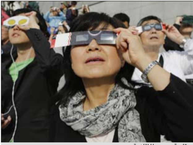
متابعة ورصد للظاهرة