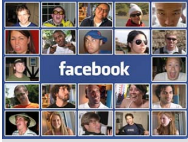
التجارية للموقع، إذ إن مشكلة فيسبوك هو كونه موقعا تجاريا قائما على تحقيق أرباح من خلال

لندن - أ.ش.: أطلق عالما كبيوتر كنديان مؤخرا موقع «كويت فيسبوك داي» أو «يوم مغادرة فيسبوك»، وهو موقع يدعو المسجلين على موقع فيسبوك صراحة إلى مغادرة جماعة للموقع يوم 31 مايو الجاري بسبب عدم احترامه للحياة الشخصية للمستخدمين والمعلومات الخاصة بهم. ويشجع «كويت فيسبوك داي» مستعملي فيسبوك على طي صفحة الماضي وطرق أبواب مواقع أخرى تقدم خدمات للتواصل الاجتماعي شبيهة بخدمات فيسبوك أشهرها موقع «دياسبورا»، الذي ظهر مؤخرا والذي يقدم نفسه على أنه سيضع حاجزا بين المعلومات الشخصية للأفراد والأغراض