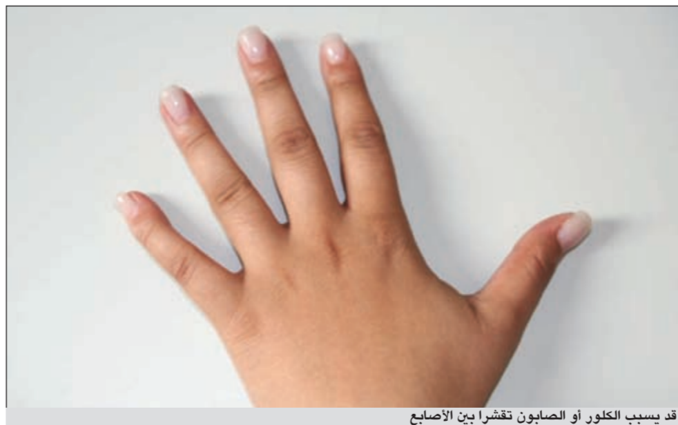
قد يسبب الكلور أو الصابون تقشراً بين الاصابع

هذه العملية تجري بتخدير موضعي ام تخدير كامل؟