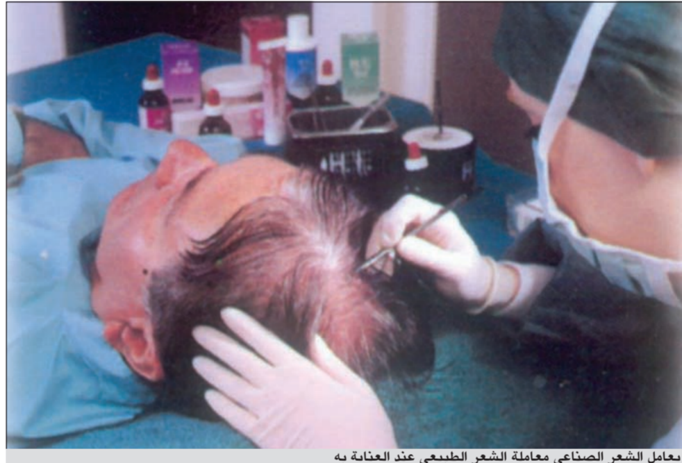
يعامل الشعر الصناعي معاملة الشعر الطبيعي عند العناية به