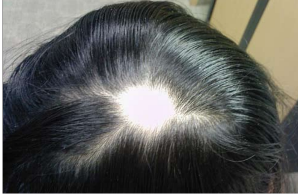
الشعر الصناعي يفيد في ملء الفراغات

● بعد هذه العملية ينقص الكثير من الوزن وتكون النتيجة ترهل الجلد، ويحتاج بعدها الجسم لإعادة مرونة الجلد، عن طريق تحفيز الكولاجين ليكون اكثر ليونة وأكثر شداً، وذلك عن طريق جهاز يتم من خارج الجسم على جلسات اسبوعية.