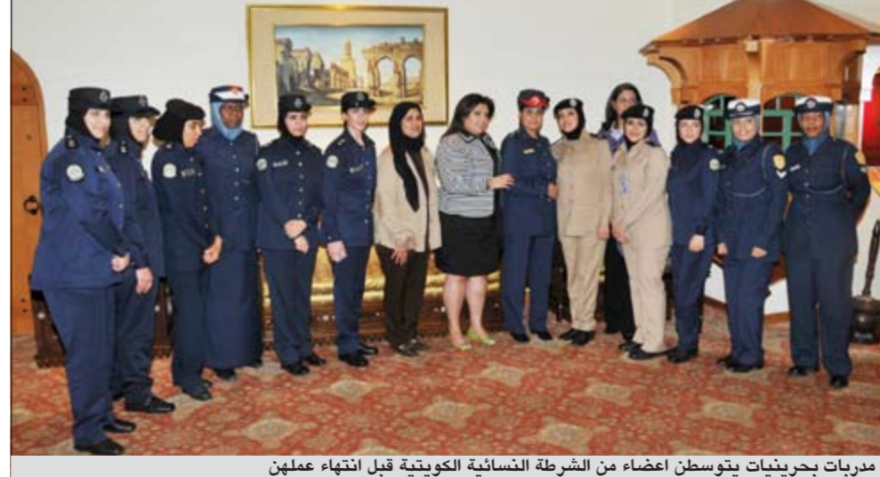
مدربات بحرينيات يتوسطن اعضاء من الشرطة النسائية الكويتية قبل انتهاء عملهن