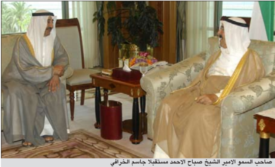
صاحب السمو الأمير الشيخ صباح الاحمد مستقبلا جاسم الخرافي

الرئاسية، متمنيا لسموه كل التوفيق والسداد وموفور الصحة والعالية وللعلاقات الطيبة بين البلدين الصديقين المزيد من التطور والنماء.