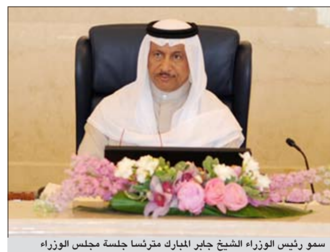
سمو رئيس الوزراء الشيخ جابر المبارك مترئسا جلسة مجلس الوزراء

وفقا لنصوص اللائحة الداخلية لمجلس الأمة والضوابط التي وضعتها المحكمة الدستورية في هذا الخصوص. وقد استمع مجلس الوزراء إلى الردود والإيضاحات التي ساقها نائب رئيس مجلس الوزراء ووزير المالية في رده على الاستجوابين المشار إليهما بما تضمنه كل منهما من محاور وأوجه دفاعه وحججه في تفنيد ما ورد بهما ويؤكد مجلس الوزراء أن الاستجواب حق دستوري لعضو مجلس الأمة بوصفه أداة الرقابة البرلمانية الهادفة على أعمال السلطة التنفيذية يتم ممارسته وفق الضوابط والقواعد التي نظمها الدستور واللائحة الداخلية لمجلس الأمة وكشفت عنها المحكمة الدستورية في حكمها الصادر في الطلب التفسيري رقم 8 لسنة 2004 والأعراف البرلمانية المستقرة. ويتطلع مجلس الوزراء إلى أن تكون مناقشة الاستجوابين في إطار الممارسة البرلمانية الهادفة المتفقة والإجراءات البرلمانية الصحيحة والحققة للمصلحة العامة، مؤكدا دعمه ومساندته لنائب رئيس مجلس الوزراء ووزير المالية مصطفى الشمالي إيمانا بسلامة موقفه وحرصه المعهود على الالتزام بالدستور والقانون ونموها بما يتعين به من نظافة اليد والنزاهة والإخلاص. وضمن إطار حرص الحكومة على حل مشكلة تسريح المواطنين العاملين في بعض الشركات والمؤسسات في القطاع الخاص وتالفي الآثار المترتبة على ذلك وحفاظا على استقرار الأسرة الكويتية وبناء على عرض نائب رئيس مجلس الوزراء ووزير المالية مصطفى الشمالي رئيس مجلس