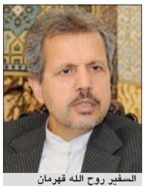
السفير روح الله قهرماني

في تصريح صحفي أشاد السفير الإيراني بنتائج الزيارة