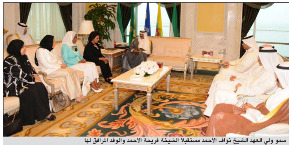
سمو ولي العهد الشيخ نواف الاحمد مستقبلا الشيخة فريحة الاحمد والوفد المرافق لها

من جهتها أكدت الشيخة فريحة ان الدعم المستمر من صاحب السمو الأمير وسمو ولي العهد