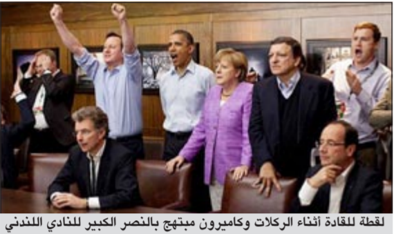
لقطة للقيادة أثناء الركلات وكاميرون مبهتج بالنصر الكبير للنادي اللندني

وسط جلسات نقاش ركزت على الاقتصاد العالمي والأمن الغذائي، وجد زعماء مجموعة الثمانية فسحة من الوقت ليشاهدوا ركلات الترجيح في المباراة النهائية بدوري أبطال أوروبا والتي جمعت تشلسي وبايرن ميونخ وفاز فيها فريق تشلسي بلقب البطولة. ولم ترغب المستشارة الألمانية أنجيلا ميركل ولا رئيس الوزراء البريطاني ديفيد كاميرون في أن تفتتبا فرصة مشاهدة المباراة التي أقيمت الليلة قبل الماضية، فقام البيت الأبيض بإعداد شاشة عرض خاصة في المسرح التابع للاستراحة الخاصة بالرئيس الأميركي باراك أوباما في جبال كاتوكتين بولاية ميريلاند.