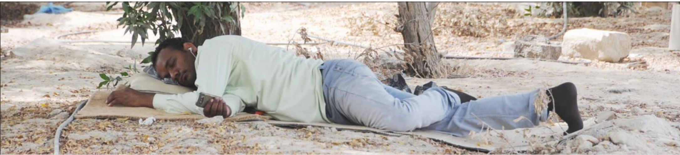
نومة هنية في بلد الأمن والأمان