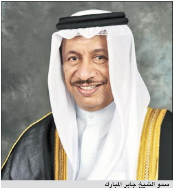
سمو الشيخ جابر المبارك

نحن مجموعة من ضباط الصف المتقاعدين المسرحين من الخدمة لأسباب صحية بسبب العجز الدائم الذي يفوق الـ 50% والبعوض أصبح عنده اعاقه وهذا قبل 2008 نتمنى ان ينظر الينا بعين الاعتبار ونرجو ان يشملنا قرار 495 وراتب السنيتين اسوة بزملانا في السلاح. لقد خدمنا بلدنا بكل ما نملك ولا نطالب الا بحقنا في المساواة ونناشد سمو رئيس الوزراء بان ينصفنا فنحن ابناءؤه واخوانه. ● مجموعة من المتقاعدين