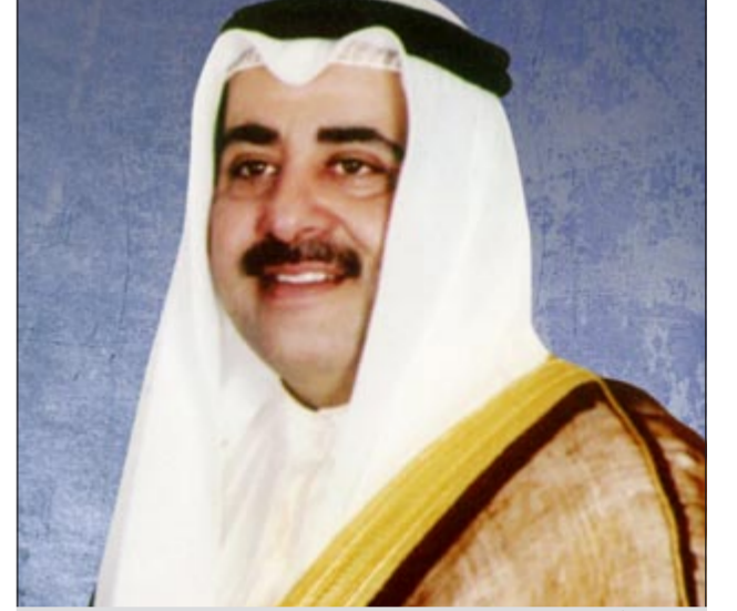
الشيخ أحمد الحمود

ناشد مقيم مصري نائب رئيس الوزراء ووزير الداخلية الشيخ أحمد الحمود رفع الظلم عنه، بعد أن تم ضبطه وهو في طريقه للتقديم للعمل في شركة غير التي يعمل فيها، وأصر رجال