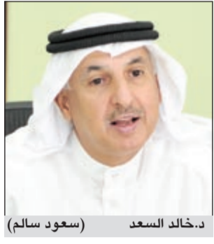
د.خالد السعد (سعود سالم)

وكيل وزارة التعليم العالي د.خالد السعد في حوار خاص مع «الانبياء»: