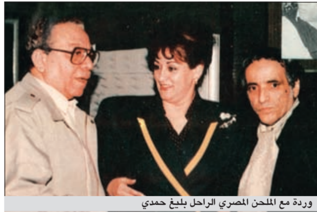
وردة مع الملحن المصري الراحل بليغ حمدي

وكانت السفارة الجزائرية في القاهرة أول جهة علمت بخبر وفاة الفنانة الجزائرية وردة، فانتقل السفير نذير الغرياي وبعض مسؤولي السفارة إلى منزل وردة، ويعددا بدأوا الإجراءات الخاصة بنقل جثمان الراحلة إلى بلادها الجزائر، وذلك عقب وصول أوامر من الرئيس الجزائري عبدالعزیز بو بوتفليقة بإرسال طائرة خاصة