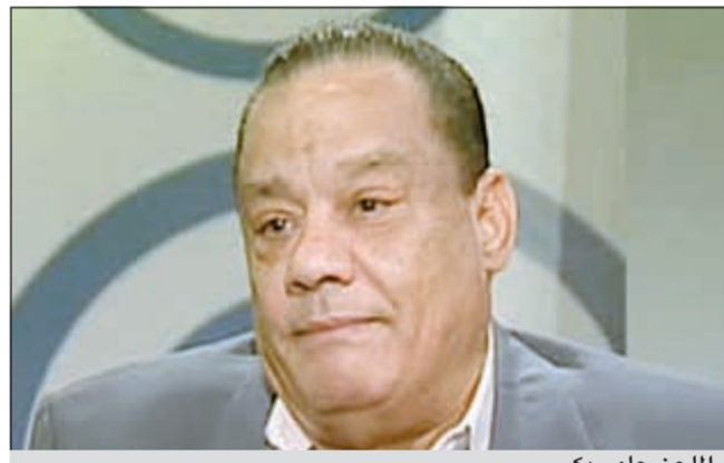
الملحن حلمي بكر

إلى ان عمرها ناهز الثمانين. وحافظت وردة على علاقتها بمصر، البلد الذي شهد شهرتها ومشوارها الفني الحقيقي بدءا بمشاركاتها في فيلم «الظ وعبيد الحامولي» مروراً بمشاركاتها كبار الأصوات العربية المعروفة في حينه غناء أوبريت «وطي الأكبر» لحمد عبدالوهاب إلى جانب عبدالحليم حافظ وصباح ونجاة الصغيرة وشادية وغيرهم.