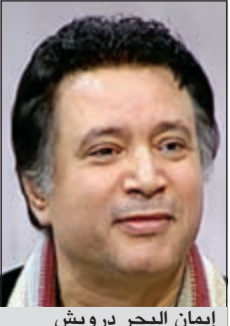
إيمان البحر درويش

أكد الفنان إيمان البحر درويش، نقيب الموسيقيين المصريين، أنه قرر إقامة حفل للفنانة القديرة وردة تقديرا وتكريما لها على مشوارها الفني الذي قدمته في حياتها، وسيكون تحت إشراف نقابة الموسيقيين بمساعدة الموسيقار عمار الشريعي والمنتج محسن جابر ومجموعة أخرى من المحللين والشعراء، لأن هذا أقل شيء من الممكن أن يقدم لها كونها فنانة أسعدت العالم كله بطربها الجميل.