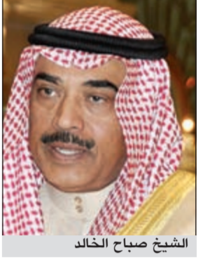
الشيخ صباح الخالد

يعقد «مجلس دعم العلاقات الإعلامية الكويتية - العراقية» اجتماعه الأول بالكويت في منتصف شهر يونيو المقبل لبحث سبل تطوير العلاقات الإعلامية بين البلدين الشقيقين بعد ان شهدت علاقاتهما تطوراً ايجابياً ملحوظاً تجاوز مرحلة الماضي واستشراف آفاق التعاون المشترك في المستقبل على كافة الأصعدة. وقد تمثل ذلك بزيارته صاحب السمو الأمير الشيخ صباح الأحمد الى بغداد لحضور مؤتمر القمة العربية وتصريحاته التي يستلهم