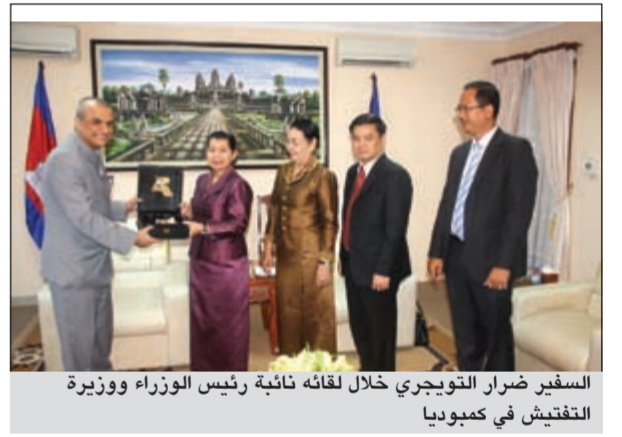
السفير ضرار التويزري خلال لقائه نائبة رئيس الوزراء ووزيرة التفتيش في كمبوديا

كوالامبور - كونا: بحث سفيرنا لدى مملكة كمبوديا ضرار التويزري سبل تعزيز وتوثيق التعاون مع نائبة رئيس الوزراء ووزيرة التفتيش والشؤون البرلمانية ومجلس الشيوخ في كمبوديا من سام