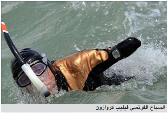
السباح الفرنسي فيليب كروازون

«لقد احتجت الي ساعة ونصف الساعة الإضافية لاني كنت اسبح بعكس التيار. لقد قطعتم المسافة بسبع ساعات و35 دقيقة و35 ثانية».