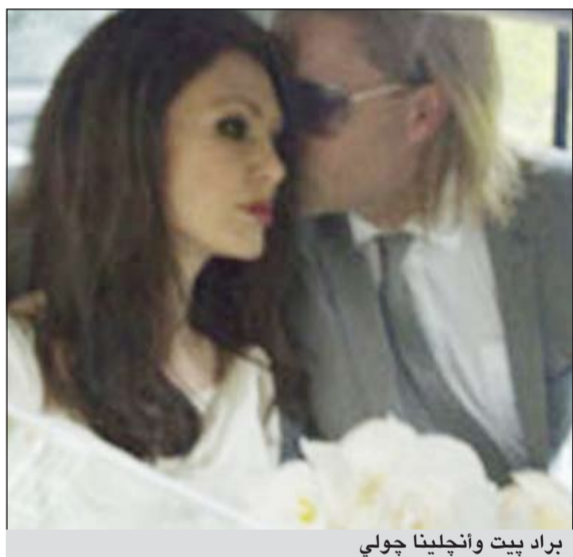
براد بيت وأنجلينا جولي

وكالات: فوجئ رواد الفيسبوك وغيره من المواقع الإلكترونية اول مسن امس بانتشار كم كبير من صورة قبل انها من حفل زفاف النجمة العالمية أنجلينا جولي وبراد بيت، وهو الأمر الذي أثار فرحة الكثيرين من محبي الثنائي الأشهر بهوليوود.