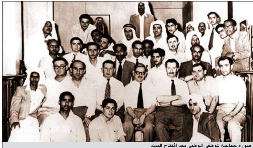
صورة جماعية لموظفي الوطني بعد افتتاح البنك