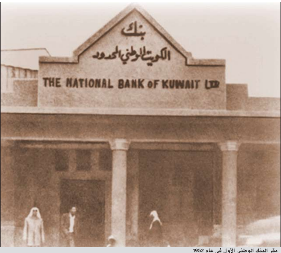
مقر البنك الوطني الأول في عام 1952