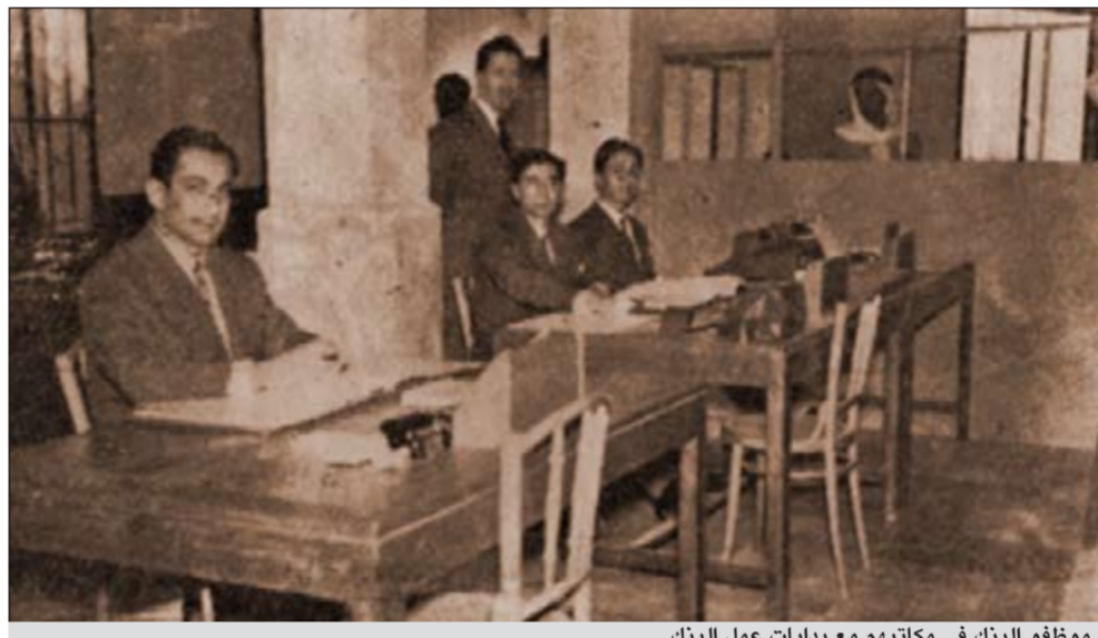
موظفو البنك في مكاتبهم مع بدايات عمل البنك

ولأن المعدن الحقيقي يزداد برهقة في اللحظات الحرجة ولا تعرف قيمته إلا في زمن الأزمات، فقد شكلت أزمة انهيار سوق الأسهم الكويتية والمسماة «أزمة سوق المناخ» عام 1982، فرصة لبنك الكويت الوطني ليثبت عراقته، إذ شكل أسلوب العمل المصرفي المتزن والمتحفظ والذي طبع مسيرة البنك منذ التأسيس حتى اليوم، عاملاً حاسماً في جعله المؤسسة الوطنية الوحيدة الناجية من تداعيات تلك الأزمة بحيث لم يتأثر بها بخلاف مختلف المؤسسات والمصارف المحلية الأخرى، ونتيجة لذلك أطلق عليه اسم «البنك الفائض الوحيد»، علماً أن تقاريره الدورية ونشراته الاقتصادية آنذاك - التي كانت من النشاطات النادرة في منطقة الخليج - لطالما حذرت