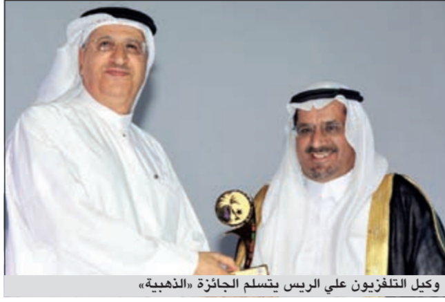
وكيل التلفزيون علي الرئيس يتسلم جائزة «الذهبية»