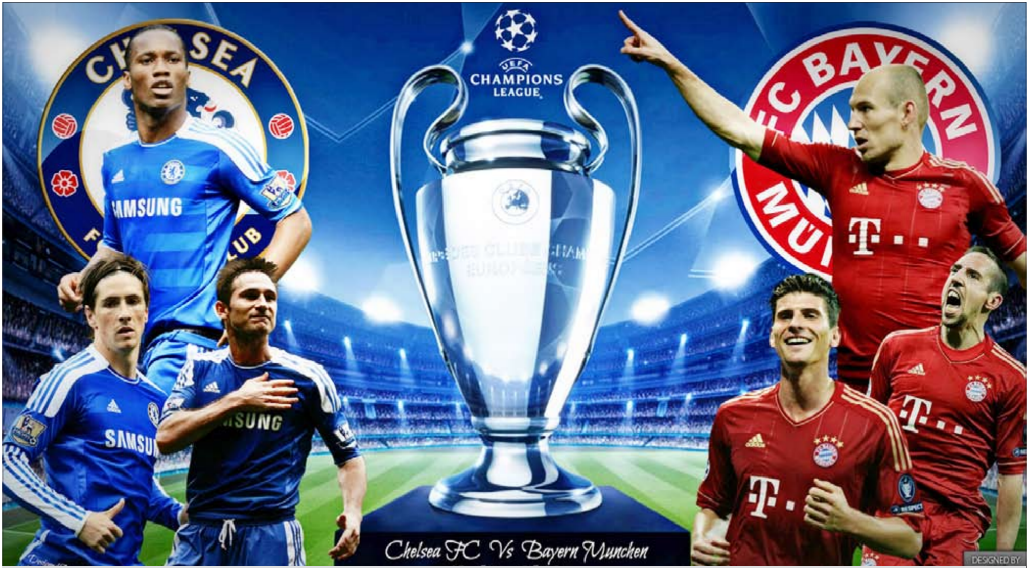
صراع بين نجوم بايرن ميونخ روبن وريبيري وغوميز ونجوم تشلسي دروغبا ولامبارد وتوريس

ومن جانبه اعتبر رئيس النادي البافاري أولي هونيس أن النهائي سيكون «نقطة القمة في تاريخ بايرن ميونخ»، ويشكل النهائي «السيناريو المثالي، وربما الوحيد» على ملعب اليانسس أرينا، ويحال الفوز سيكون «من دون شك الأهم في تاريخ النادي».