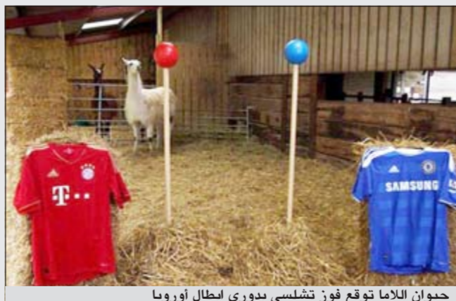
حيوان اللاما توقع فوز تشلسي بدوري أبطال أوروبا

المنتزه ترك حيوان اللاما اختيار النتيجة. وقد منح اللاما خيارين: كرتان واحدة حمراء وأخرى زرقاء وضعت كل واحدة منهما على