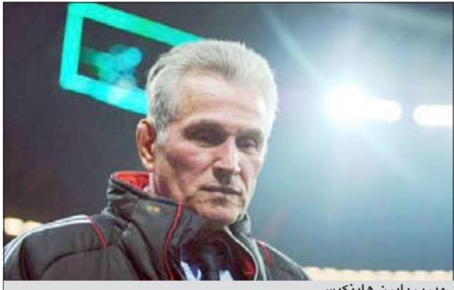
مدرب بايرن هاينكيس