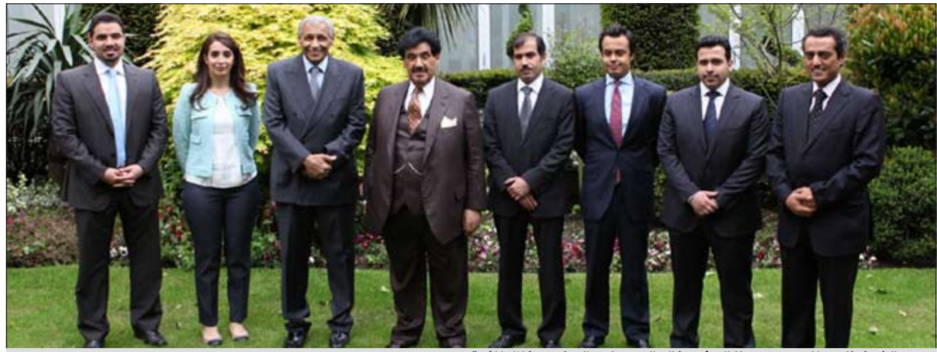
سمو الشيخ ناصر المحمد متوسلا السفير خالد الدويسان والحضور خلال المأدبة

حضر ممثل صاحب السمو الأمير الشيخ صباح الأحمد سمو الشيخ ناصر المحمد مأدبة الغداء التي اقامتها ملكة بريطانيا اليزابيث الثانية بمناسبة احتفالها بالذكرى الـ 60 على توليها مقاليد الحكم في المملكة المتحدة لبريطانيا العظمى وايرلندا الشمالية. ونقل سمو الشيخ ناصر المحمد تحيات وتهنئة صاحب السمو الأمير باسم الشعب الكويتي على توليها عرش بريطانيا العظمى. وردت الملكة اليزابيث الثانية بالشكر لصاحب السمو الأمير على تهنئته والشعب الكويتي مستنكرة جلالتهما زيارتها للكويت. واقام سفيرنا لدى المملكة المتحدة خالد الدويسان مأدبة غداء على شرف ممثل صاحب