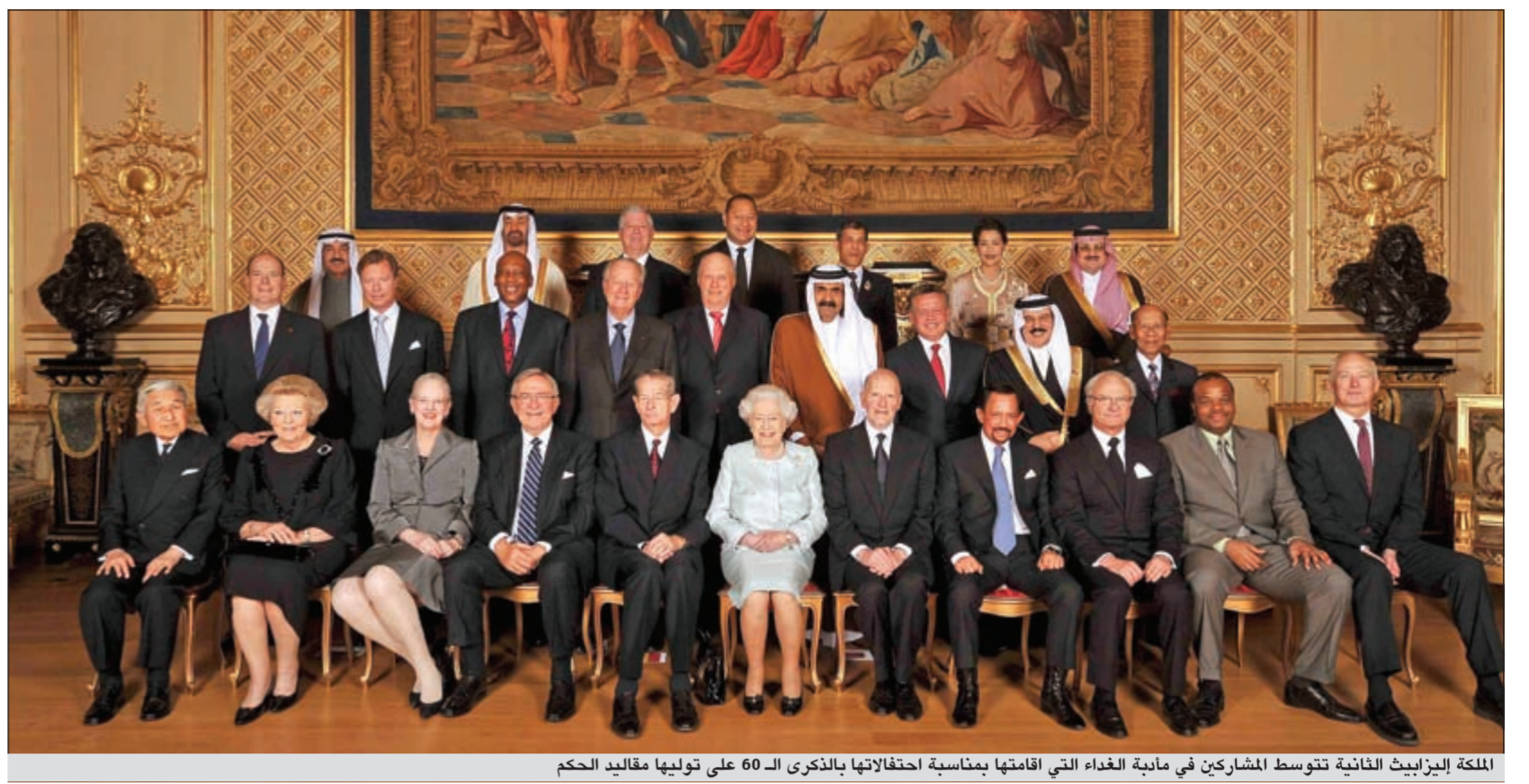
الملكة إليزابيث الثانية تتوسط المشاركين في مأدبة الغداء التي اقامتها بمناسبة احتفالها بالذكرى الـ 60 على توليها مقاليد الحكم