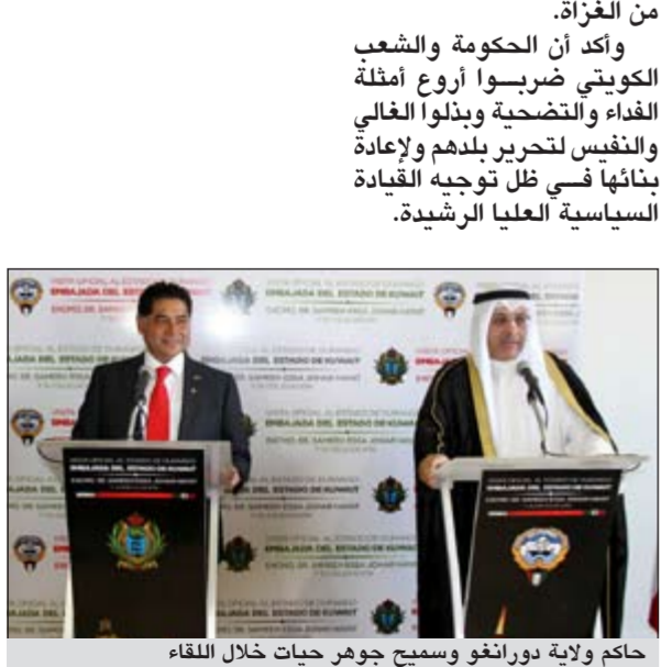
حاكم ولاية دورانغو وسيمع جوهر حيات خلال اللقاء

المعامل والمستثمرين المكسيكيين للمشاركة في خطة التنمية الكويتية. من جانبه تحدث حاكم ولاية دورانغو بكل فخر واعتزاز عن صداقته مع الكويت مشيراً في هذا الصدد الى ما عانته الكويت من قيادة وحكومة وشعباً من جراء الاحتلال العراقي للكويت في عام 1990 ومشدد على أهمية التعلم والاستفادة من العزم والإرادة الصلبة والخبرات الكويتية في إعادة بناء بلدهم بعد تحريرها من الغزاة. وأكد ان الحكومة والشعب الكويتي ضربوا أروع أمثلة الفداء والتضحية وبذلوا الغالي والنفيس لتحرير بلدهم وإعادة بنائها في ظل توجيه القيادة السياسية العليا الرشيدة.