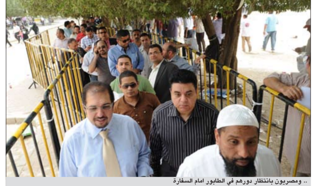
.. ومصريون بانتظار دورهم في الطابور أمام السفارة

سبيل إنجاز هذا العرس الديمقراطي ومشهداً في هذا الإطار بالجهود الكبيرة لرجال وزارة الداخلية. وأبدى عدد من الناخبين أسس فرحتهم بالمشاركة في العملية الانتخابية مؤكداً أنها فرحة لكل المصريين الذين سلب منهم هذا الحق على مدى تاريخهم وبخاصة في ظل النظام السابق الذي اعتبر المصريين في الخارج مجرد أرقام لتحويل الأموال دون أي حقوق لهم من الدولة. وشدد الناخبون على أنه لولا فضل الله ثم ثورة 25 يناير ما توجت مطالبهم بالتصويت في الانتخابات المصرية مؤكداً في الوقت ذاته أن الشعب المصري اليوم أوعى من أي عهد سبق ويستطيع أن يميز بين من يقف مع الثورة وتحقق مبادئها وأهدافها