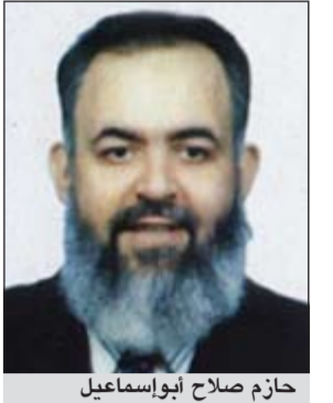
حازم صلاح أبوإسماعيل

بسبب إظهار بعض المستندات في برنامج «هنا القاهرة» الذي يذاع على قناة «الرحمة» تفيد حصول الدكتورة نوال الديرج المستبعد من سباق الرئاسة الشيخ حازم صلاح أبوإسماعيل على الجنسية الأمريكية، صدر قرار من الشيخ محمد حسان رئيس القناة بإيقاف البرنامج.