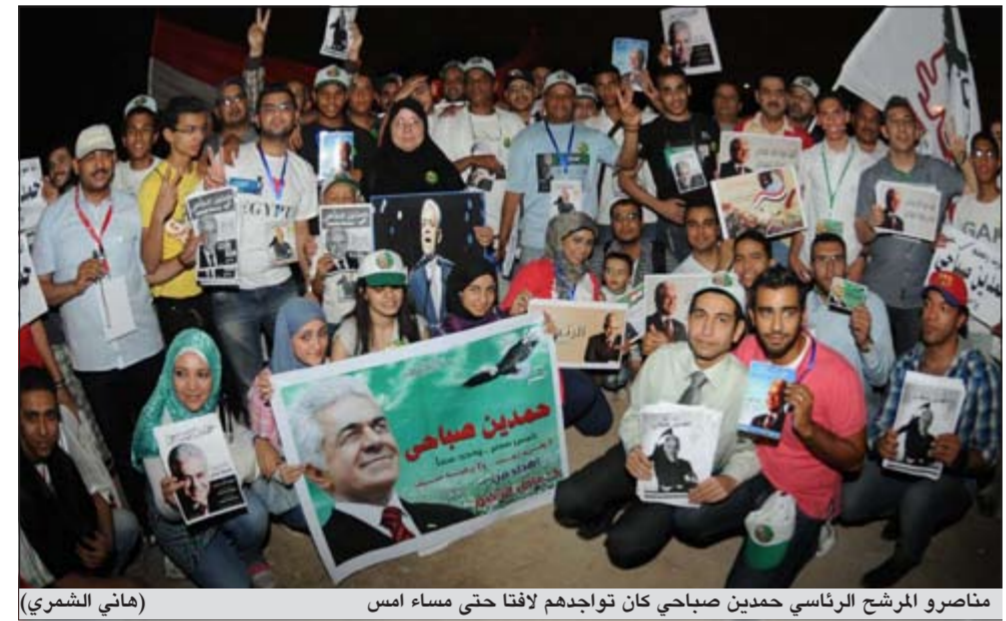
متناصرو المرشح الرئاسي حمدين صباحي كان تواجدهم لافتاً حتى مساء أمس

القاهرة - د.ب.؛ أكد وزير خارجية مصر محمد كامل عمرو أمس أن عملية تصويت المصريين بالخارج في الانتخابات الرئاسية، التي بدأت مطلع الأسبوع وانتهت مساء أمس، تمت بنجاح وسهولة. وقال عمرو «حتى ظهر أمس قام 224 ألفا و448 مصرياً بالتصويت في الخارج»، مؤكداً أن باب التصويت أغلق في الثامنة من مساء أمس طبقاً لتعليمات اللجنة العليا للانتخابات. وأوضح أن الرياض جاءت في المرتبة الأولى حيث صوت حوالي 60 ألفاً بينما الكويت 43 ألفاً وجمدة 42 ألفاً. مشيراً إلى أن التصويت تم إجراؤه في 139 قنصلية وسفارة مصرية بدول العالم. وأكد عمرو أن عملية التصويت تمت بنجاح وسهولة حيث تم لأول مرة تطبيق «الرقم التسلسل» بحيث يضمن عدم تكرار التصويت مرة أخرى لأي مواطن. وأوضح أنه كان هناك 25 حالة لتكرار التصويت من بين 225 ألف مصري أدلوا بأصواتهم وهي نسبة صغيرة كما توجد مندوبو المرشحين المعتمدين ووسائل الإعلام ومنظمات المجتمع المدني المعتمدة.