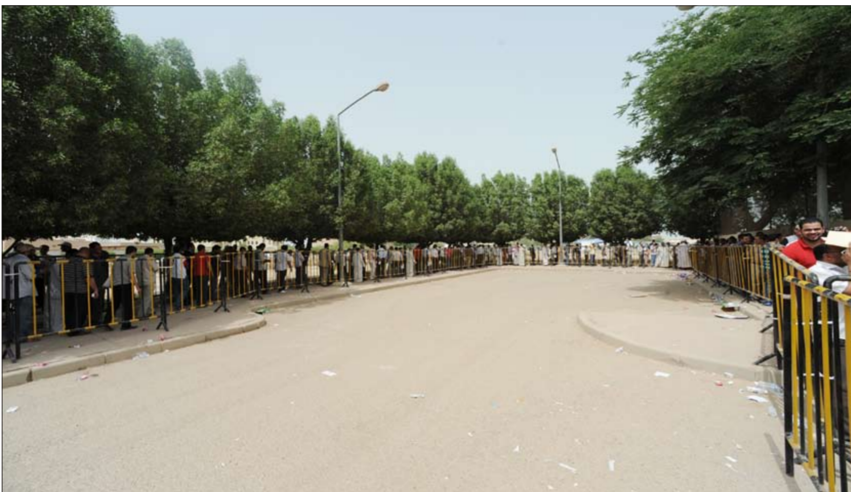
حشود ضخمة من الناخبين المصريين اصطفوا في طوابير طويلة أمام مبنى السفارة ليدلوا بأصواتهم في آخر يوم للاقتراع لهم خارج مصر (اسامة ابو عطية)