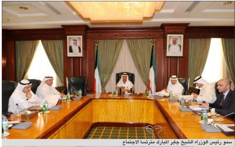
سمو رئيس الوزراء الشيخ جابر المبارك مترأساً الاجتماع

ترأس سمو الشيخ جابر المبارك رئيس مجلس الوزراء في قصر السيف صباح أمس الاجتماع الأول للمجلس الأعلى للتخصيص. والقي سمو رئيس مجلس الوزراء كلمة افتتاحية في الاجتماع شدد فيها على أهمية تأسيس المجلس الأعلى للتخصيص وضورته بشأن تنظييم برامج وعمليات التخصيص، مشيراً إلى التحدي المتمثل في تحويل اقتصادنا الوطني وحرص الحكومة على تحقيق رؤية صاحب السمو الأمير بتحويل الكويت إلى مركز مالي وتجاري إقليمي جاذب لرؤوس الأموال المحلية والأجنبية. وقال سموه إن الحكومة تعمل على تخطي مرحلة الاعتماد على الإنتاج النفطي كمصدر رئيسي للدخل القومي من خلال الاقتصاد المتنوع الذي يركز على التعاون العادل بين القطاعين العام والخاص.