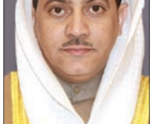
الشيخ سلمان الحمود

حث وكيل وزارة الاعلام الشيخ سلمان الحمود ورئيس تحرير موسوعة السياحة العربية د.حسن عاصي سبل التعاون الاعلامي بين الوزارة والموسوعة. وقالت وزارة الاعلام في بيان صحافي امس ان اللقاء بين الجانبين تناول مجمل ما يخص السياحة والسياحة في الكويت وترويجها اعلاميا لجماهير الخبراء في مختلف دول العالم. وتصدر موسوعة السياحة العربية في العاصمة اللبنانية بيروت وتهتم بكل ما يتعلق بأمور السياحة وامكانها وتطورها في العالم العربي.