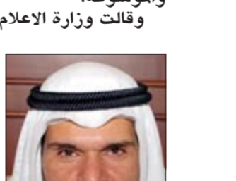
الشيخ سلمان الحمود

تسلم نائب رئيس مجلس الوزراء وزير الخارجية ووزير الدولة لشؤون مجلس الوزراء الشيخ صباح الخالد نسخة من أوراق اعتماد سفير جمهورية بلغاريا الكسندر بوريسوف اولشيفسكي كسفير لبلاده لدى الكويت. جرت مراسم قبول أوراق الاعتماد في مبنى وزارة الخارجية أمس بحضور وكيل وزارة الخارجية خالد الجارالله ومدير إدارة مكتب نائب رئيس مجلس الوزراء وزير الخارجية الشيخ د.أحمد ناصر المحمد والمستشار من إدارة المراسم صلاح مبارك المطيري.