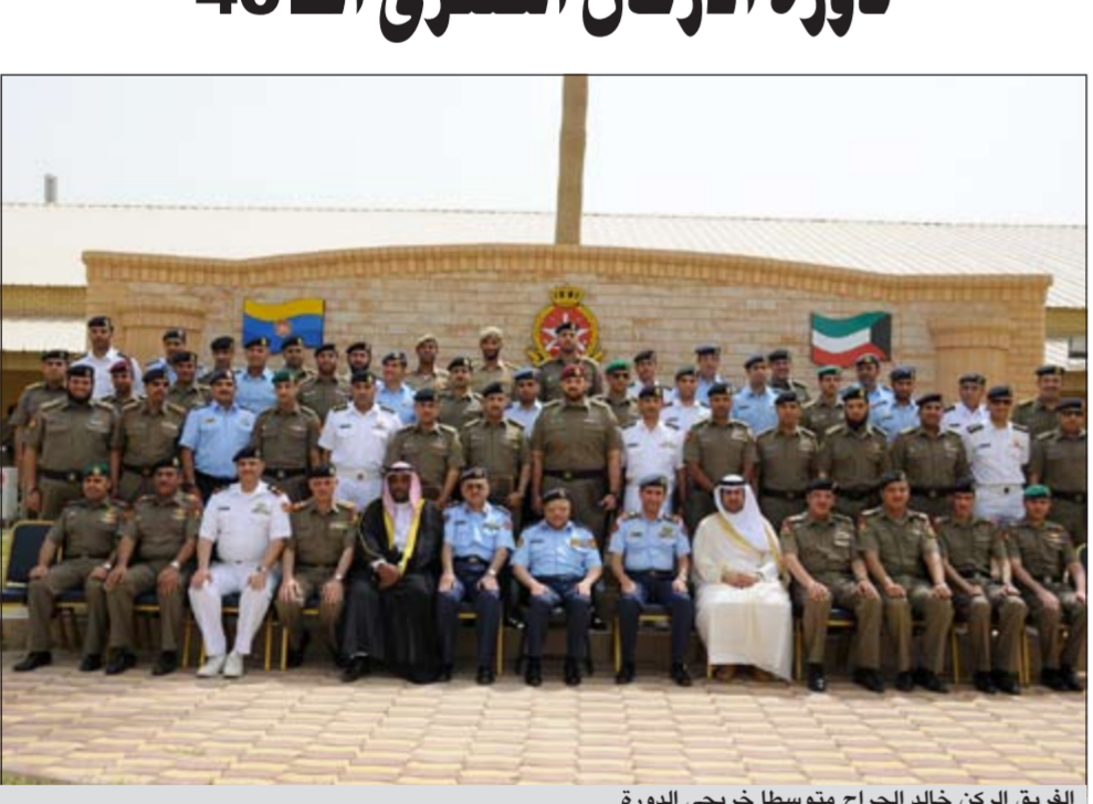
الفريق الركن خالد الجراح متوسط خريجي الدورة

يحقق الامن والإمان لهذا الوطن وان تبقى رايته دائما عالية خفاقة. وكان الحفل بدأ بكلمة كبير المعلمين في مدرسة الأركان الصغرى بين خلالها نوعية المناهج والدروس والتدريبات العملية التي تلقاها منتسبو هذه الدورة التي انطلقت في 19 فبراير الماضي طيلة فترة دراستهم والتي شملت دروسا عسكرية نظرية وعملية. حضر حفل التخريج رئيس هيئة التعليم العسكري اللواء الركن أنور جاسم المزدي وممثلو سفارتي البحرين وقطر لدى البلاد وعدد من قيادات الجيش.