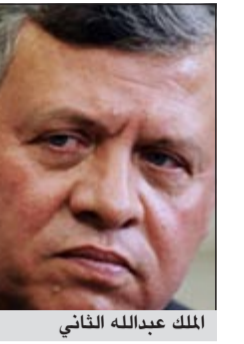
الملك عبدالله الثاني

عمان - أ.ش.: افتتح العاهل الأردني الملك عبدالله الثاني الثلاثاء متحف الرسول ﷺ، في حرم مسجد الملك الحسين بن طلال في عمان. وقال وزير الأوقاف والشؤون والمقدسات الإسلامية الأردني د. عبد السلام العبادي، إن المتحف يضم مقتنيات تحمل دلالات مهمة في تاريخ الإسلام، ففيه الرسالة التي وجهها الرسول ﷺ إلى هرقل وهي النسخة الأصلية التي كتبت على قطعة من الجلد، ويضم شئلة من شجرة البقيعاوية التي استظل بها الرسول أثناء رحلته الأولى إلى بلاد الشام وهي شجرة تقع في البادية الأردنية، إلى جانب شعرة من لحية الشريفة. وأضاف العبادي أن الجهات المعنية في الأردن ستعمل من أجل استكمال وجلب مزيد من الآثار المتعلقة برسول الله ﷺ، ولو على سبيل الإعارة.