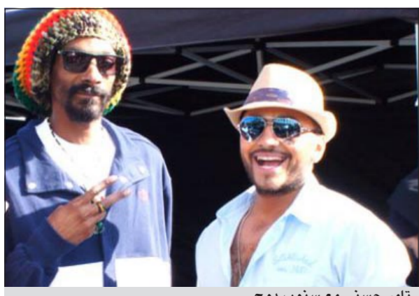
تامر حسني مع سنوب دوج

الكشّن. وأشارت رندا إلى أن تصوير كليب «سي السيد» استغرق 18 ساعة وسوف يغني سنوب دوج كلمات عربية في الأغنية، مشيرة إلى أن الأغنية تترج بين الغتتين العربية والإنجليزية، إلا أنها ستطرح نسخة أخرى باللغة الإنجليزية.