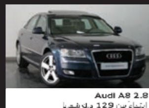
Audi A8 2.8 ابتداءً من 129 د.ك شهرياً