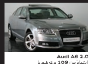
Audi A6 2.0 ابتداءً من 109 د.ك شهرياً