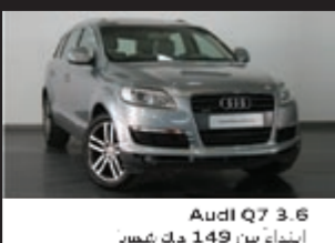
Audi Q7 3.6 ابتداءً من 149 د.ك شهرياً