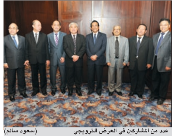
عدد من المشاركين في العرض الترويجي (سعود سالم)

عقدت السفارة الإندونيسية عرضاً ترويجياً للسياحة في اندونيسيا وذلك في فندق جي دبليو ماريوت مساء أول من أمس، وذلك وسط حضور عدد من أركان السفارة الإندونيسية وعدد كبير من المدعوين من بين ممثلين للمكاتب السياحية في البلاد وشركات السياحة الإندونيسية.