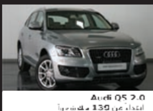
Audi Q5 2.0 ابتداءً من 139 د.ك شهرياً