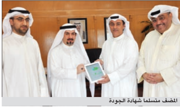
المضف متسلماً شهادة الجودة

ويقوم نظام «اوركسترا» إضافة إلى عملية تنظيم تدفق العملاء للفروع، بتزويد الإدارة العليا في البنك ببيانات إحصائية وتقارير يومية - أسبوعية - شهرية عن أعداد المراجعين، ووقت الانتظار، ومدة إنجاز المعاملة، بالإضافة إلى ربط جميع الفروع بعضهم ببعض مما يتيح لإدارة البنك متابعة سير العمل وقياسه في جميع الفروع من خلال جهاز الـ iPad، سعياً للارتقاء بمستوى الأداء، كما قام البنك بربط شاشات التلفاز الموجودة لديه في جميع قاعات انتظار الفرع الرئيسي مع نظام الكوماند متيحاً للعميل حرية متابعة القنوات التلفزيونية دون أن يؤثر ذلك على خدمتهم وتنظيم الدور، وبذلك يكون بنك التسليف والادخار أول مؤسسة وجهة حكومية كويتية تستخدم تلك التقنية لمتابعة خدمة العملاء ليس فقط على مستوى الكويت ولكن على المستوى العالمي أيضاً.