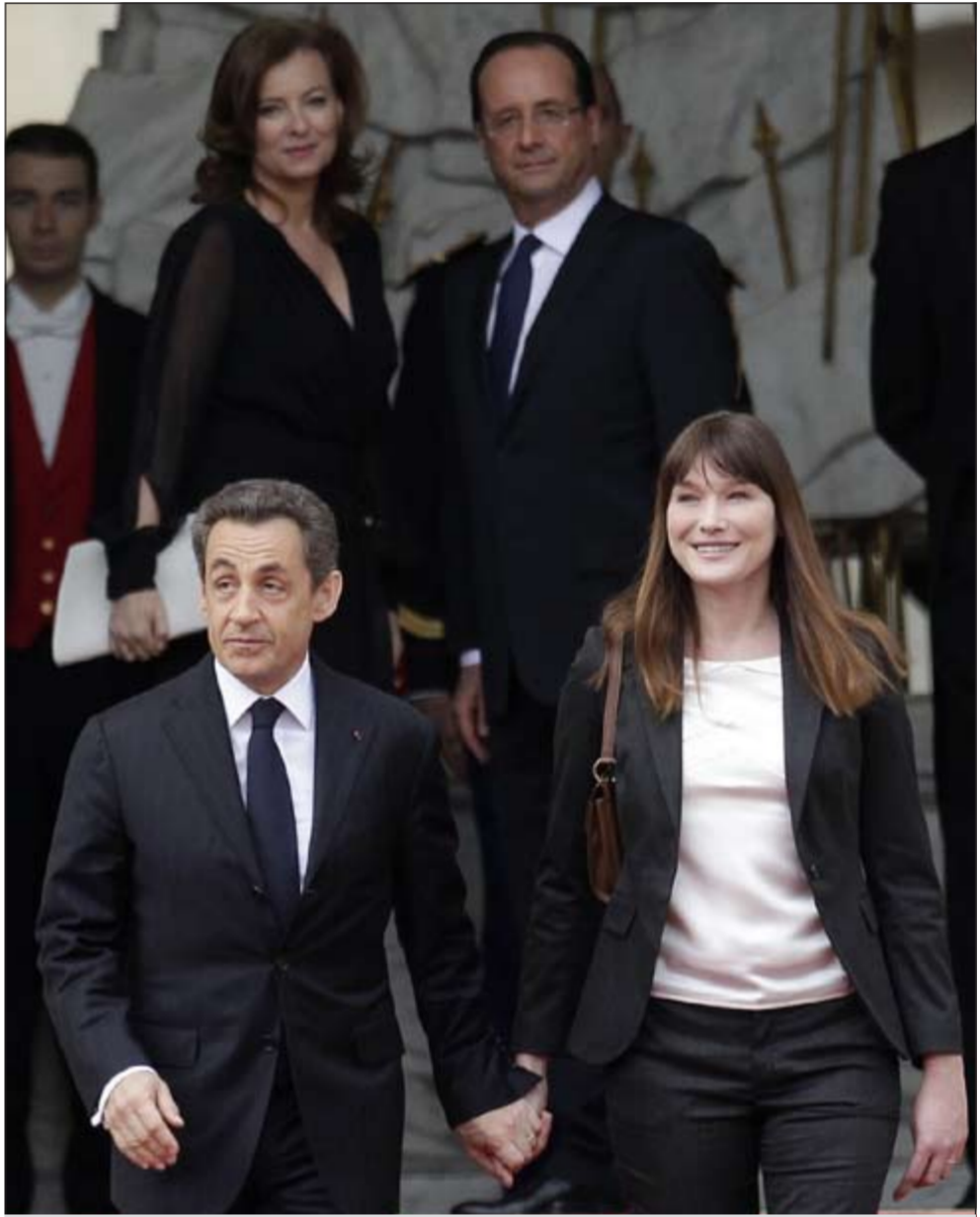
الإنجليزية يودع ساركوزي وزوجته.. ويستقبل هولاند وصديقه فاليري

باريس - وكالات: تسلم الاشتراكي فرانسوا هولاند أمس رسمياً السلطة من الرئيس المنتهية ولايته نيكولا ساركوزي بعد أن أدى اليمين الدستورية ليصبح أول رئيس اشتراكي لفرنسا منذ 17 عاماً.