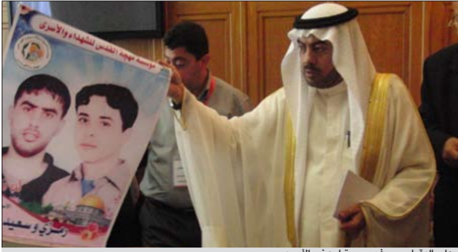
علي الدقاسي يرفع صورة لبعض الأسرى

الأعضاء حول الاعتداءات المتكررة على السودان من دولة جنوب السودان، وما نجم عنها من خسائر اقتصادية وبشرية وبيئية ومادية مختلفة، بالإضافة إلى بحث الأوضاع الإنسانية الناجمة عن اعتداء دولة الجنوب على المواطنين السودانيين وممتلكاتهم، بالإضافة إلى مناقشة الوضع في سورية والذي يزداد تازماً وتعقيداً يوماً بعد يوم والنظر في تفسير قافلة إنسانية من البرلمان العربي لدعم الشعب الصومالي والسوداني، وتعهده رئيس البرلمان العربي علي الدقاسي بمواصلة العمل لطرح قضية الأسرى والمعتقلين في سجون الاحتلال على كل المستويات والمحافل، والعمل على فضح الجرائم الإسرائيلية. جاء ذلك خلال لقاء جمع رئيس البرلمان العربي مع مجموعة من زوجات الأسرى، وبعض الأسرى المحررين وناشطين في الدفاع عن قضية الأسرى، وذلك في مقر الأمانة العامة للجامعة العربية. وأوضح الدقاسي أن البرلمان العربي يضع موضوع الأسرى والمعتقلين من أعضاء المجلس التشريعي بشكل دائم على جدول أعماله، مشدداً على خطورة الإجراءات الإسرائيلية بحق الأسرى والمعتقلين، وأكد دعم البرلمان العربي لتدويل قضية الأسرى، ونقل الملف إلى المؤسسات الأممية والجمعية العامة للأمم المتحدة، معبرا عن شكره للوفد على هذه الزيارة، وتلقي المعلومات التي قدموها له.