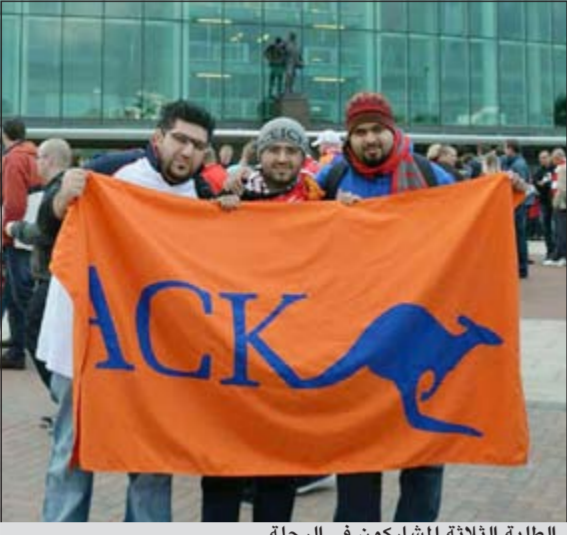
الطلبة الثلاثة المشاركون في الرحلة

جريا على عادتها في احتضان المتميزين من منتسبها وتكريمهم نظمت الكلية الأسترالية في الكويت رحلة خاصة لثلاثة من طلابها المتميزين في الأنشطة والعمل الطلابي حضروا خلالها مباراة مانشستر يونايتد وسونزي. وجاءت الرحلة في إطار الاهتمام الذي توليه الكلية للأنشطة الرياضية والطلابية بشكل عام والبارزين فيها من طلابها. إذ تحرص ادارة الكلية على توجيه الدعم والتشجيع اللازم لهم بهدف الحفاظ على حماسهم وتحفيزهم نحو المزيد من الاجادة والتميز. وعاشت مجموعة الطلاب التي وقع عليها الاختيار تجربة مثيرة بامتياز وعاودوا محفلين بذكرات لا يمكن نسيانها بسرعة بشأن المباراة والاجواء المحيطة بها ومتابعة اللعب لأحد أشهر الفرق الأوروبية في كرة القدم وما يضمنه من لاعبين دوليين وما يعنيه ذلك من متعة وتميز.