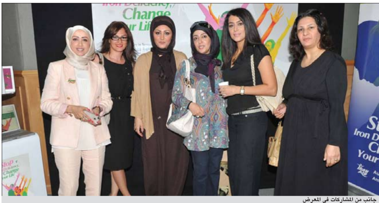
جانبا من المشاركات في المعرض