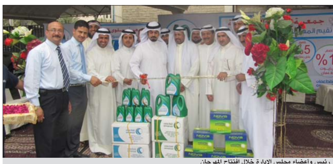
رئيس وعضو مجلس الإدارة خلال افتتاح المهرجان

أصدر رئيس مجلس الإدارة المدير العام للهيئة العامة للزراعة والذروة السمكية م. جاسم الجبر قراراً يقضي بصرف دعم الأعلاف للمربين اعتباراً من 2012/4/1 وذلك ضمن حدود المبلغ المخصص لهذا الدعم في ميزانية السنة المالية 2013/2012. كما حدد القرار الضوابط والشروط المطلوبة لصرف الدعم وذلك على النحو التالي: ● تصرفت الإعلاف المدعومة للمربين بموجب بطاقات الاعلاف القابلة للصرف والمعتمدة على أساس شهادة تحصين سارية المفعول وحسب المقررات العلفية المستحقة لكل منهم والصادرة من الهيئة. ● تصرفت الإعلاف المدعومة لصاحب بطاقة العلف شخصياً او لمن ينوب عنه بتوكيل معتمد من قبيل الجهة المختصة بالدولة او بموجب التفويض المعتمد لذلك والصادر من الهيئة معتمداً منه امام الجهة المختصة. ● يحق لصاحب العلاقة سواء كان المربي شخص طبيعياً او من ذوي الاعاقة تفويض من يراه مناسباً للاقرب من الدرجة الأولى أو الثانية أو الثالثة وكذلك من يعمل لديه على كفالته. ● تمنح المخصصات المدعومة للمربين ومزارع الإبقار والدواجن والنعام حسب بطاقات الاعلاف