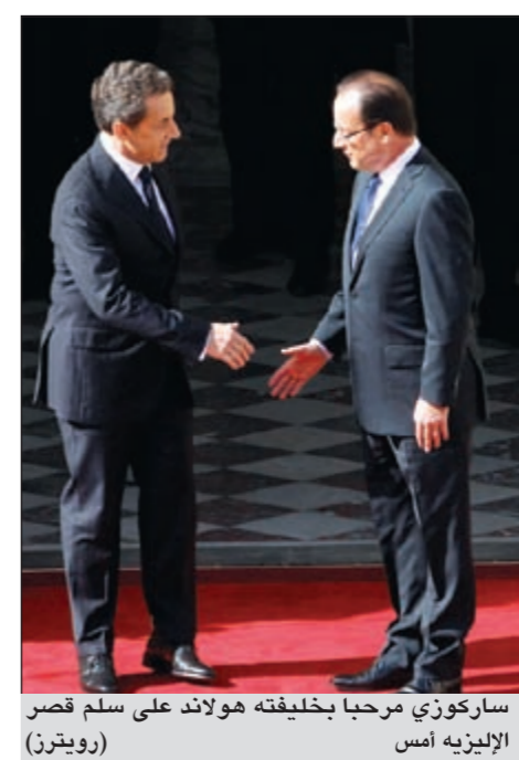
ساركوزي مرحبا بخليفته هولاند على سلم قصر الإليزيه أمس (رويترز)

باريس - وكالات: في خطاب تنصيبه رئيسا لفرنسا رسميا أمس قال فرانسوا هولاند: «إنه يتطلع لإعادة فرنسا للوقوف على أقدامها في ظل العدالة ورغم أي تحد، وفتح مسار جديد في أوروبا، والمساهمة في السلام العالمي». ولكن خليفة ساركوزي لم يكن يدري أن أول تحد سيواجهه هو سبب سبب مع «الطبيعة». فبعد مراسم تنصيبه، استقل هولاند طائرة «فالكون سفين أكس» الرئاسية متجها بها إلى برلين. وما هي إلا دقائق معدودة من إقلاعها من باريس إلا و«البرق» كان لها بالمرصاد، ليواجه هولاند في أول أيام رئاسته تحديات «الطبيعة». فرجعت طائرته إلى فرنسا مرة أخرى ليستقل طائرة أخرى من طراز «فالكون 900» ليحلق بها إلى برلين التي وصلها هذه المرة دون تحديات. التفاصيل من 50