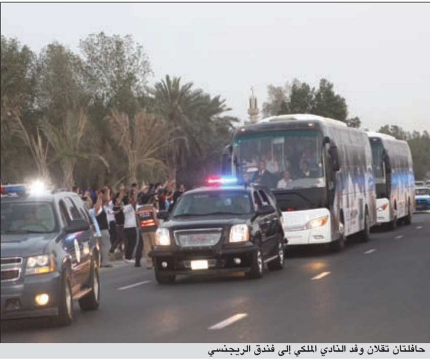
حافلتان تقلان وفد النادي الملكي إلى فندق الريجنسي